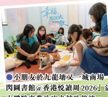
●小朋友於九龍塘又一城商場「快閃圖書館@香港悅讀周2026」活動中體驗專業治療犬輔助伴讀。

全城投入，共沐書香，同尋幸福，隨著系列活動的成功舉辦，「香港悅讀周2026」至此圓滿落幕。