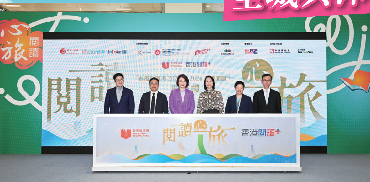
●「香港悅讀周2026暨2026香港閱讀+」開幕禮上，主禮嘉賓(左起)立法會議員霍啟剛，深圳市委宣傳部副部長蘇榮才，立法會主席李慧琼，康文署署長陳詠雯，文創產業專員黎錫明以及立法會議員、香港出版總會會長李家駒合照。