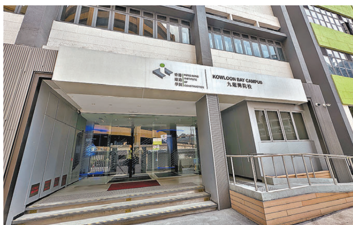
●廉政公署落案起訴一名香港建造學院時任導師及其友人涉採購物料隱瞞利益衝突。圖為香港建造學院。

香港文匯報訊(記者 蕭景源) 廉政公署落案起訴一名香港建造學院時任導師及其友人，涉嫌在採購時隱瞞物料供應商由二人操控，分別誤導其僱主以獲取訂單。廉署接獲投訴展開調查，發現兩名被告是中學同學，二人創立御智(香港)有限公司，並涉嫌安排另一名中學同學登記為該公司的唯一股東兼董事，以隱瞞二人是該公司的實際東主，以及他們在當中擁有的利益。調查顯示，該公司於案發期間從建造業議會及The Lab分別取得兩張及10張訂單，涉及款項共逾20萬元。案件昨日在觀塘裁判法院提訊，押至6月30日再訊，兩被告獲准保釋。