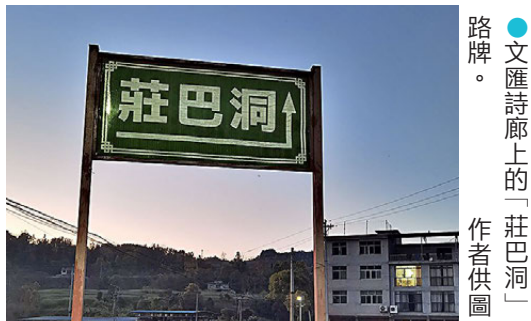
●文匯詩廊上的「莊巴洞」路牌。

此外，石會的兩大產業景觀亦可圈可點。一是珠蘭花茶，一是莊巴洞酒。珠蘭花又稱金粟蘭、珍珠蘭、魚子蘭、茶蘭等，為常綠蔓性灌木。花開時形如魚籽，色如黃金，香如幽蘭，與茉莉、白蘭、玳玳並稱「中國四大茶用香花」。經鑒定，珠蘭花含有32種化合物、60餘