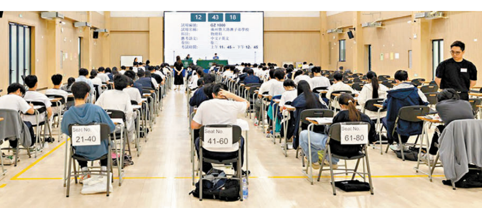
●考評局今年繼續於深圳香港培僑書院龍華信義學校、廣州南沙民心港人子弟學校及廣州暨大港澳子弟學校（見圖）設立試點考場。

容、收生要求及校園環境，各所大學將相繼舉行入學諮詢相關活動。其中，香港大學率先在明日及後日（7日及8日）舉行資訊環節供2026聯招申請人參與。香港理工大學亦將於周六（9日）舉行實體聯招諮詢日2026。下周起，香港浸會大學、香港城市大學、嶺南大學、香港都會大學、香港科技大學、香港教育大學等將陸續舉辦相關活動。