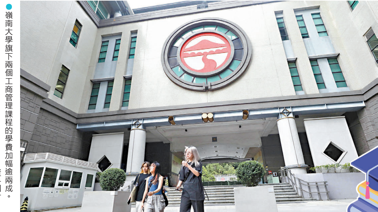
嶺南大學旗下一個工商管理課程的學費加幅逾兩成。資料圖片。

註：學費為合資格本地學生須繳交費用，已扣除政府相應的NMTSS或SSSDP資助，資助額按計劃及課程性質，由35,120元至89,620元不等 資料來源：iPASS 整理：香港文匯報記者 史柳藝