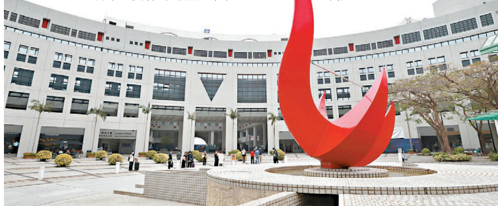
●科大開辦的全球工管課程學費上調至逾56.3萬元，四年學費總額近128萬元。圖為科大校園。