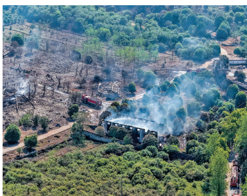
●5日，在湖南長沙瀏陽市拍攝的事故現場。