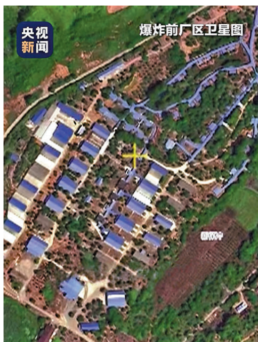
●圖左為爆炸前烟花廠的衛星圖，圖右為爆炸後的廠區。