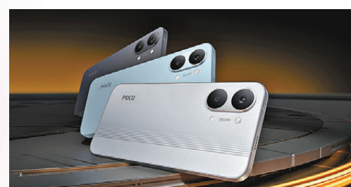
●POCO X8 Pro Series