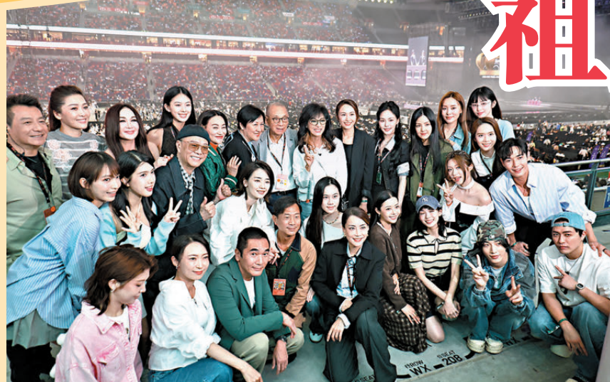
楊受成夫婦率一眾旗下藝人前來捧場。