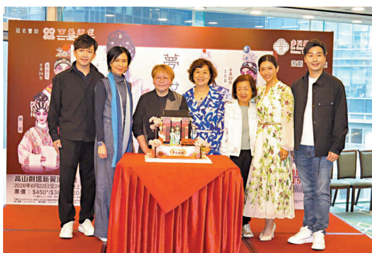
眾人齊撐《夢說紅樓》。

到觀眾支持。今次是非同劇團的第二部作品，她坦言有過上次經驗已沒太緊張，希望憑藉這個平台讓志同道合的年輕演員獻技，擦出新火花，為粵劇創新。