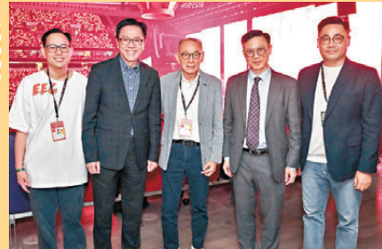
楊受成父子與律政司副司長張國鈞(右二)、創新科技及工業局局長孫東(左二)及立法會議員葉傲冬(右一)一同合照。