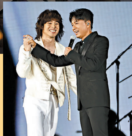
李克勤(右)與曾比特合作愉快。

女團VIVA昨晚以性感服飾跳唱吸睛，作為大師姐的祖兒更盡顯天后風範，以火辣紅色Bra top，在數十名舞蹈員伴舞下性感登場，無間斷地連環以《未知》《桃色冒險》《逃》及《Pretty Crazy》快歌勁舞足足17分鐘，強勁節奏搭配凌厲精準的舞步，將全場氣氛推向頂峰，贏盡掌聲。表演完畢，她感謝公司栽培，及今次為