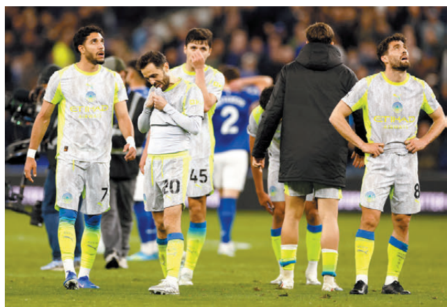
●曼城球員賽後難掩失落。

香港文匯報訊(記者 楊浩然)因早前擊敗阿仙奴而奪冠機會大增的曼城，於香港時間昨日(5日)凌晨英超作客僅以3:3賽和愛華頓，痛失爭冠主導權。