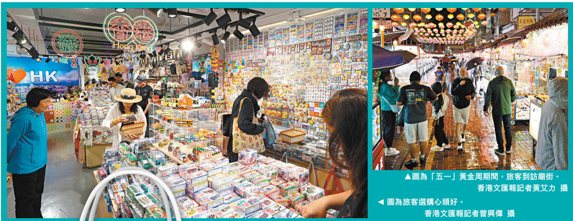
▲圖為「五一」黃金周期間，旅客到訪廟街。

她預期黃金假期後旅客生意會回落，對於4月零售業表現，她表示4月復活節長假是市民外遊高峰期，影響本地消費市道，但由於去年4月是全年零售額最低月份，在基數低的情況下，預料今年4月零售仍可能錄得升幅，而5月整體上平穩，零售額或有增幅，惟憂慮美伊衝突持續，影響消費氣氛。