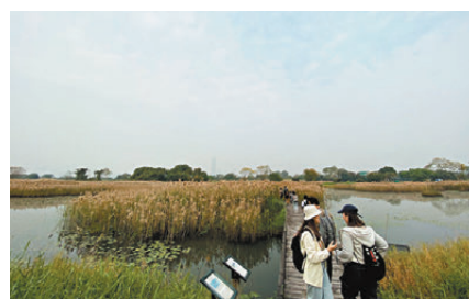
●圖為米埔自然保護區。資料圖片 無須持有禁區許可證，以便利遊客到訪紅花嶺郊野公園一帶。

另外，政府去年1月24日開放蓮麻坑附近指明邊境禁區路段，豁免乘坐專營小巴通過該路段人士申請禁區許可證，經審視成效後，警務處處長修訂《邊境禁區(准許進入)公告》作為永久措施，乘坐專營小巴進入或離開蓮麻坑的人士