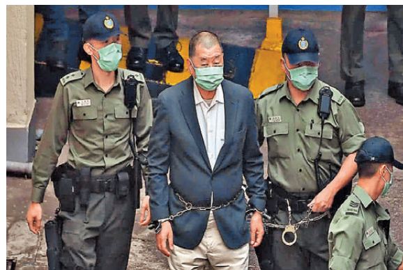
●黎智英(左二) 資料圖片

立法會議員陳祖光表示，近來美國反華政客藉黎智英案頻頻發聲，動不動打着「自由」旗號指手畫腳，表面看似義正詞嚴，實則不過是又一次政治操作，將一宗罪證確鑿的案件，硬說成「打壓新聞自由」，這不單是抹黑香港法治，更可說是對事實選擇性失明。他強調媒體人不等於有特權，無論在