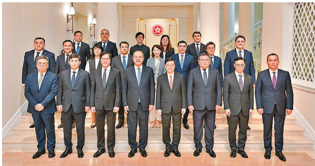
●李家超（第一排右四）昨日與訪港的烏茲別克斯坦總理阿卜杜拉尼格馬托維奇阿里波夫（第一排左四）會面。

香港文匯報訊 香港特區行政長官李家超昨日在禮賓府與烏茲別克斯坦總理阿卜杜拉尼格馬托維奇阿里波夫會面，就進一步加強香港和烏茲別克斯坦合作交流意見。財政司副司長黃偉倫、律政司副司長張國鈞、商務及經濟發展局局長丘應樞和行政長官辦公室主任葉文娟亦有出席。