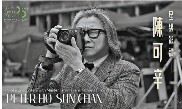
●陳可辛的作品兼具文藝情懷與香港視角。星級影談 PETER HO SUN CHAN