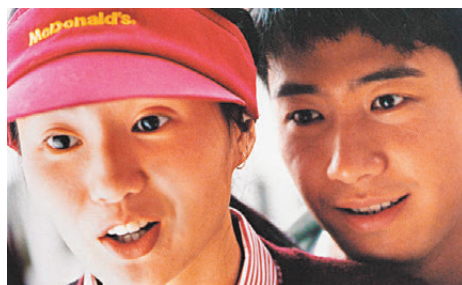
●陳可辛執導的《甜蜜蜜》曾橫掃九項金像獎殊榮。

是次選映陳可辛的4部代表作，分別為黎明和張曼玉主演的《甜蜜蜜》、黃曉明、鄧超及佟大為主演的《中國合夥人》、梁朝偉、梁家輝及鄭丹瑞主演的《風塵三俠》、李連杰、劉德華和金城武主演的《投名狀》，另選映兩部對陳可辛影響深遠的荷里活經典電影《北非諜影》及《西線無戰事》；此外，6月19日資料館電影院將免費放映由周迅、張學友和金城武主演的《如果·愛》。