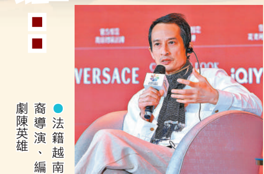
●法籍越南裔導演、編劇 陳英雄