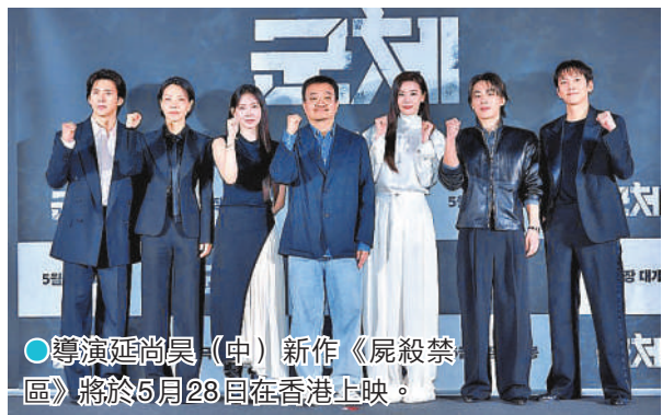
●導演延尚昊(中)新作《屍殺禁區》將於5月28日在香港上映。