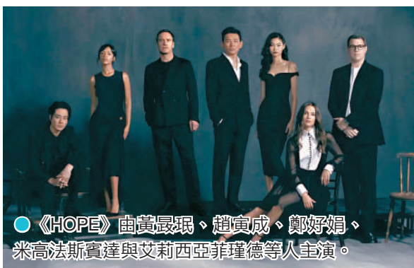
●《HOPE》由黃景瑜、趙寅成、鄭好娟、米高法斯賓達與艾莉西亞菲理德等人主演。