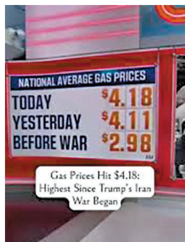
●美國國內汽油價格從戰前每加侖2.98美元飆升至4.18美元，漲幅超過40%。

隨着通脹壓力持續加大，愈來愈多的美國民眾開始削減非必要開支，餐廳客流量減少、旅行計劃取消、汽車與房產交易凍結，消費市場的疲軟進一步拖累經濟增長，形成「通脹走高—消費萎縮—經濟放緩」的惡性循環。