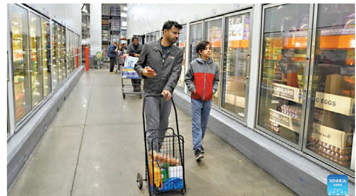
●美國3月消費者價格指數（CPI）同比上漲3.3%，遠高於2月份的2.4%，創2024年6月以來新高。圖為4月10日，人們在美國紐約一家超市購物。

貿易政策的連串失誤，則進一步放大並加劇了國內通脹壓力。特朗普上台後，以保護本土產業為名，全面打響全球貿易戰，對多個貿易夥伴大範圍加徵關稅，試圖透過進口限制為本國企業護航。然而貿易保護主義最終非但沒有達成預期目標，反而讓美國本土企業與廣大消費者承受了沉重代價。