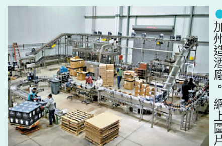
●加州造酒廠。網上圖片

力游說貿易夥伴全面恢復進口美國酒品。歐洲和日本採取類似加拿大的抵制行動，數據顯示去年美國烈酒的銷量出現兩位數字跌幅，跌勢預計在2026年持續。另外，美國國內消費者因健康和經濟原因減少飲酒，造成美國酒廠雪上加霜，面臨嚴峻的破產和裁員潮。