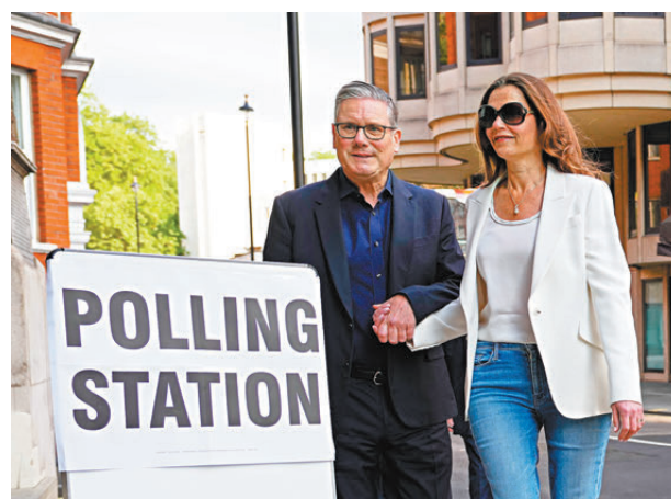
●斯塔默和夫人到倫敦市一個票站投票。

香港文匯報訊 英國執政工黨在地方選舉前，支持度一路下滑，首相斯塔默正面臨極右改革黨和左翼綠黨等細小在野黨的重大挑戰。《衛報》等傳媒分析，斯塔默內閣在經濟和移民兩大關鍵議題上，過去兩年幾乎毫無建樹，多項政策前後矛盾。伴隨選民紛紛流向其他政黨，工黨極可能損失大量議席。