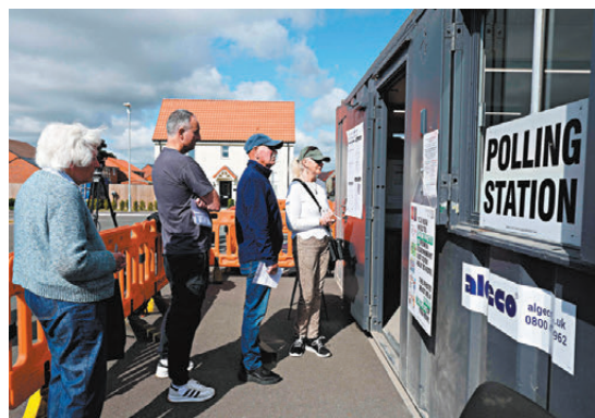
●人們到流動投票站投票。