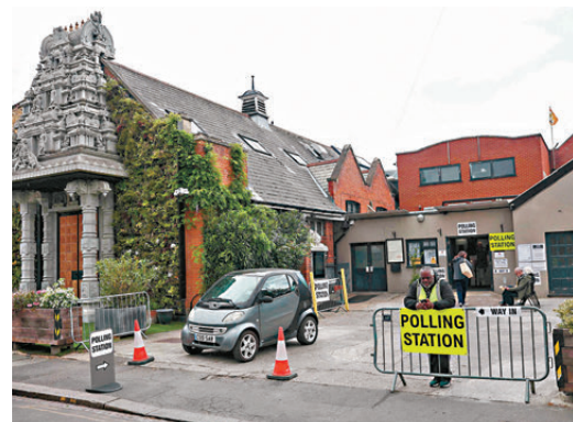
●倫敦一投票站外有保安人員駐守。