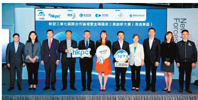
●「新型工業化國際合作論壇暨金磚國家工業創新大賽（港澳賽區）」匯聚超過百餘名來自內地、香港及澳門政產學研界代表出席。

香港文匯報訊 香港生產力促進局（下稱「生產力局」）與國家工業和信息化部國際經濟技術合作中心（國合中心）昨日在港合辦「新型工業化國際合作論壇暨金磚國家工業創新大賽（港澳賽區）」，是次活動對接國家「十五五」規劃推動科技創新與產業創新深度融合的戰略部署，加快新型工業化與綠色低碳轉型的步伐，匯聚超過百名來自內地、香港及澳門政產學研界代表出席。論壇以「綠色賦能新型工業化 共探出海合作新模式」為主題，共同探討綠色科技與產業國際化的融合路徑。