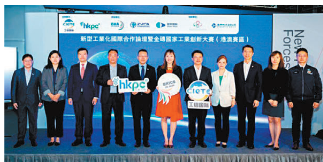
●「新型工業化國際合作論壇暨金磚國家工業創新大賽（港澳賽區）」匯聚超過百餘名來自內地、香港及澳門政產學研界代表出席。

香港文匯報訊 香港生產力促進局（下稱「生產力局」）與國家工業和信息化部國際經濟技術合作中心（國合中心）昨日在港合辦「新型工業化國際合作論壇暨金磚國家工業創新大賽（港澳賽區）」，是次活動對接國家「十五五」規劃推動科技創新與產業創新深度融合的戰略部署，加快新型工業化與綠色低碳轉型的步伐，匯聚超過百餘名來自內地、香港及澳門政產學研界代表出席。論壇以「綠色賦能新型工業化 共探出海合作新模式」為主題，共同探討綠色科技與產業國際化的融合路徑。