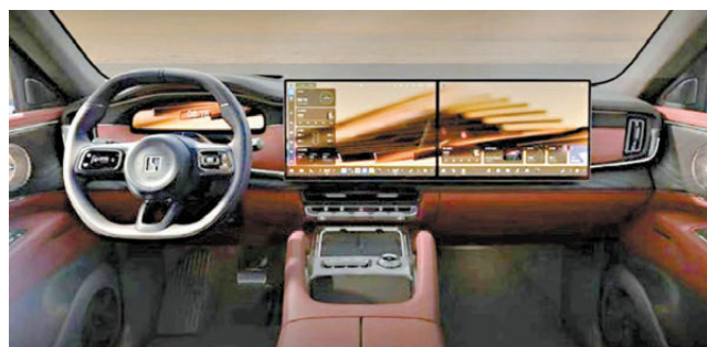
▲階躍星辰表示，未來隨着智能駕駛訂閱等商業模式成熟，將衍生出更多變現路徑。圖為搭載階躍 Step 3.5 Flash 的車款。