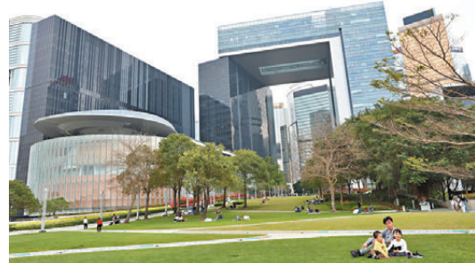
●特區政府發行的綠債及基建債涵蓋港元、人民幣、美元及歐元幣種。 資料圖片

香港文匯報訊 特區政府昨日公布，在政府可持續債券計劃和基礎建設債券計劃下，成功定價約 276 億港元等值的綠色債券（綠債）及基