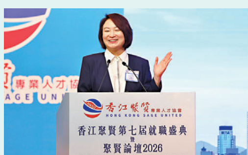
●全國人大常委會委員、立法會主席李慧琼

張國鈞在致辭時表示，期望香港聚賢能夠繼續一如既往地堅定政治立場，積極支持特區政府落實「愛國者治港」原則，維護憲制秩序，推動香港社會蓬勃發展；積極響應國家戰略，善用自身工商專業才能和國際視野，緊扣國家「十四五」規劃收官，以及「十五五」規劃的前瞻布局，推動香港融入國家發展大局，並在粵港澳大灣區建設中發揮香港工商專業人士的獨特作用。