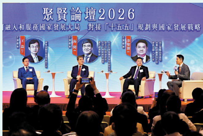
▲多名經濟學者及香港工商界人士出席論壇環節。 ▲香港聚賢專業人才協會昨日在香港會議展覽中心舉辦就職典禮。

香港聚賢專業人才協會昨日在香港會議展覽中心舉辦「聚賢求新 與您同行——香港聚賢第七屆就職盛典暨聚賢論壇2026」，全國人大常委會委員、立法會主席李慧琼，香港特區政府律政司副司長張國鈞等為就職儀式主禮，由李聖潑出任新一屆執委會首席會長，薛博然任主席。李慧琼在致辭時表示，香港特區政府正為編制香港首個五年規劃收集意見，而香港聚賢匯聚逾千名來自法律、會計、建設工程、科技創新、醫療衛生等專業人士，期望大家踴躍向特區政府和立法會提出寶貴意見，並用好自身力量繼續擔當好「超級聯繫人」和「超級增值人」，為香港、為國家發展貢獻力量。