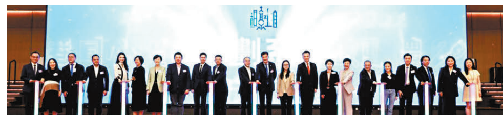
●賓主共同上台主持啟動儀式。

她透露，今年有超過1,700名學生報名，最後選出約300多位同學到上海進行6周至8周職場體驗，讓大家親身感受上海和國家的發展機遇。計劃將繼續堅持「職場實戰+文化體驗+導師陪伴」三位一體模式，涵蓋工作日沉浸式實習、周末主題探索、良師益友計劃及CEO TALK專場，幫助青年體驗內地職場文化、提升專業技能、拓寬發展視野。