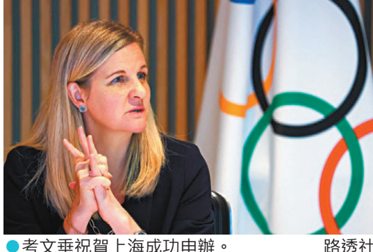
●考文垂祝賀上海成功申辦。

上海市體育局相關負責人表示，申辦2028年奧運會資格系列賽，是基於2024年該項賽事的成功經驗，希望進一步構建青年與城市雙向賦能的全球盛會。