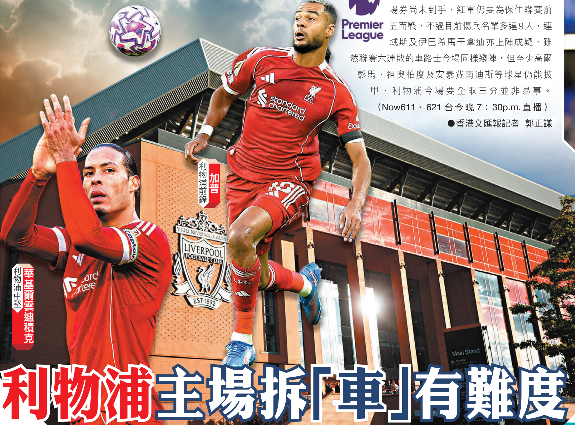
●華基爾雲迪積克 利物浦中堅