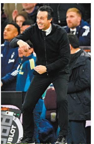
●艾馬利第六度領軍殺入歐霸盃決賽。

次回合回到主場的維拉有個好開始，上半場先有貝安迪亞助攻奧尼屈堅斯近門建功打開紀錄，換邊後貝安迪亞再入十二碼，加上約翰麥甘尼梅開二度，維拉最終以4:0大破殘陣出擊的諾定咸森林，將與弗賴堡爭奪冠軍。 艾馬利執教生涯第六度殺入歐霸盃決賽，四度捧盃的他讚揚球隊成功改善了首回合出現的問題，在主場熾熱氣氛下踢出上佳表現。不過他認為球隊的把握力仍有改進空間，決賽對弗賴堡仍是五五之爭。