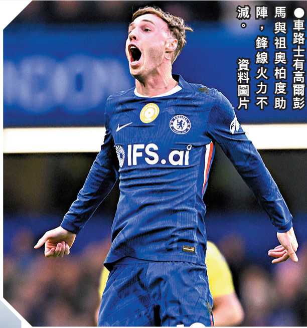
●車路士有高爾彭馬與祖奧柏度助陣，鋒線火力不減。