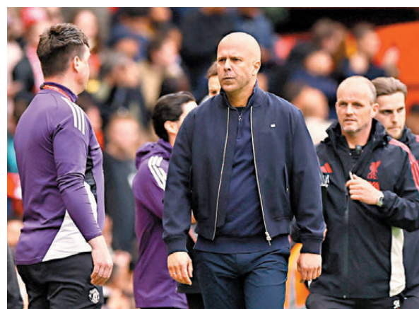
●史洛今季推行戰術改革，卻令紅軍失去侵略性。資料圖片

戰術改革，要求更多控球在腳但失去往日侵略性，後防大將華基爾雲迪積克亦直言欠缺威脅是球隊問題所在：「我們今季的表現遠低於應有水平，我們只有控球權並不足夠，而是需要創造真正的機會，我們更要積極地威脅對方球門。」史洛在短短幾日找到戰術平衡並不現實，何況利物浦今場幾乎失去半隊主力，縱使擁有主場之利，面對力爭挽回面子的車路士，要全取三分難度不小。