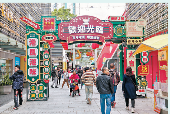
中英街成為遊客往來、消費互動的熱門目的地。

從基礎設施硬聯通，到規則機制軟對接，沙頭角口岸重建正成為深港融合高質量發展的生動縮影。未來，隨着新口岸投入使用，跨境人員、物資、資金、信息流動將更加高效便捷，鹽田也將持續以制度創新釋放發展動能，打造深港規則銜接示範標杆，為粵港澳大灣區建設注入更強動力。