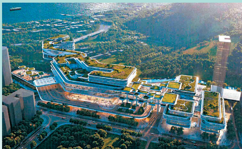
沙頭角口岸重建設計效果圖。