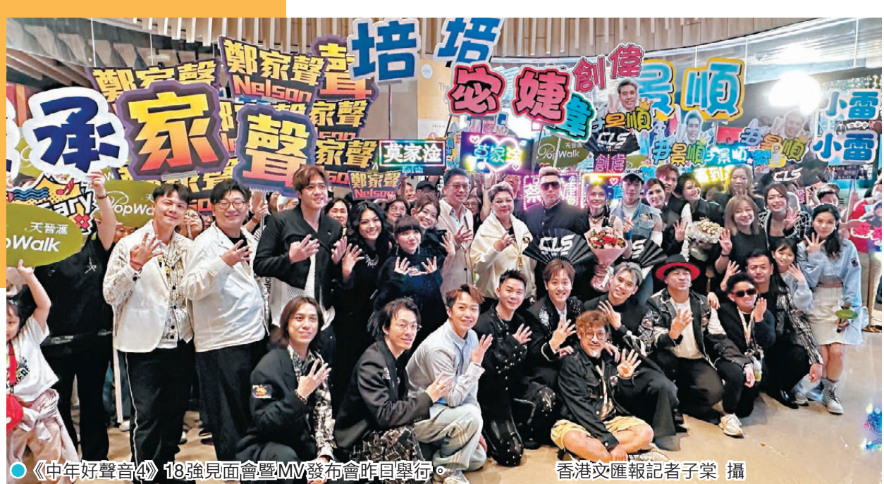
《中年好聲音4》18強見面會暨MV發布會昨日舉行。