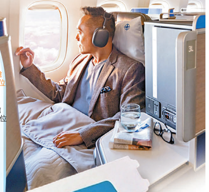
航空公司調整機艙布局，增加高端艙位以圖更大利潤。