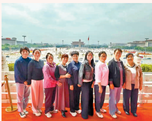
●英雄的母親和妻子們登上天安門城樓。