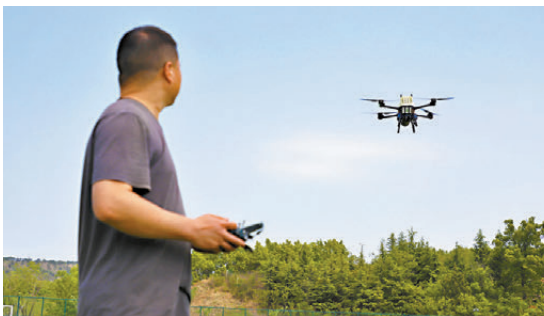
●科研人員試飛搭載高比功率陰極閉合式風冷電堆的氫能無人機。