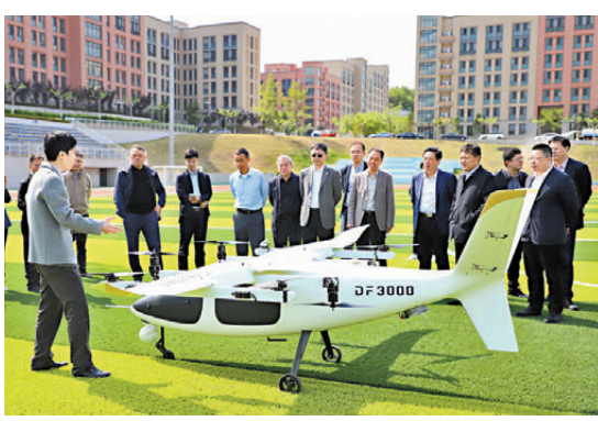
●專家院士考察高比功率陰極閉合式風冷電堆在氫能無人機上應用。

目前，項目已構建起「材料—部件—系統」的全鏈條自主研發體系，形成了完整自主知識產權，申請國內發明專利21件。項目團隊已建成陰極閉合式風冷電堆自動化產線，具備規模化交付能力，成果已成功應用於林業、農業、電力巡檢、應急救援等實際工作中，搭載該系統的工業無人機續航時間較傳統電池提升2倍以上。