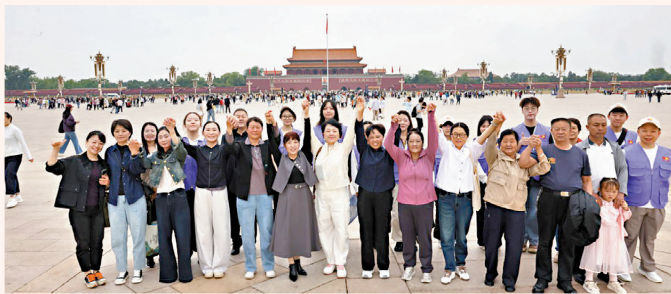
●中華英烈褒揚事業促進會邀請9位烈士母親及妻子來京參觀座談。圖為英雄母親和妻子們在天安門廣場合影留念。

在京期間，她們走進天安門、人民大會堂、中國人民革命軍事博物館等地標，感受黨和國家的溫暖關懷，接受全社會對英雄母親的深情禮讚。從出行到食宿，從陪伴到座談，社會各界用行動詮釋：「英雄為祖國獻出生命，英雄的母親就是我們的母親。」