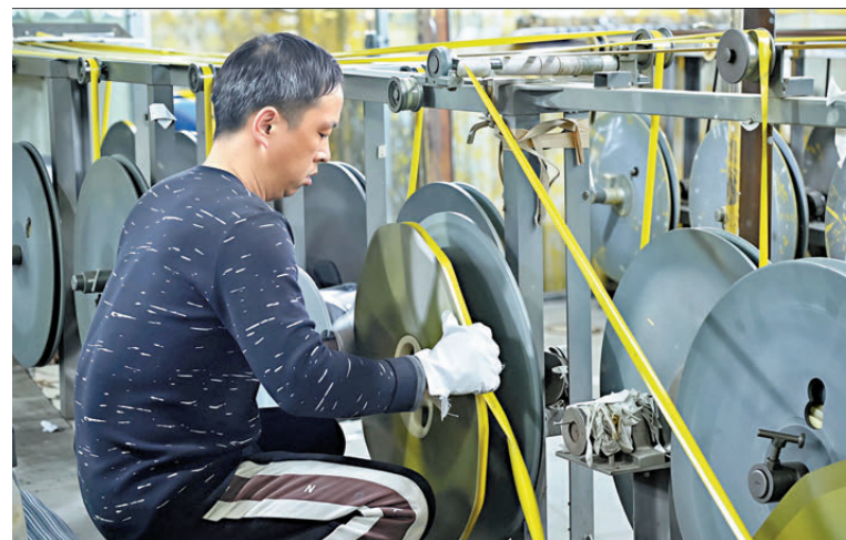
●在商丘珂銘工量具有限公司生產車間，梁師傅盯緊生產線。