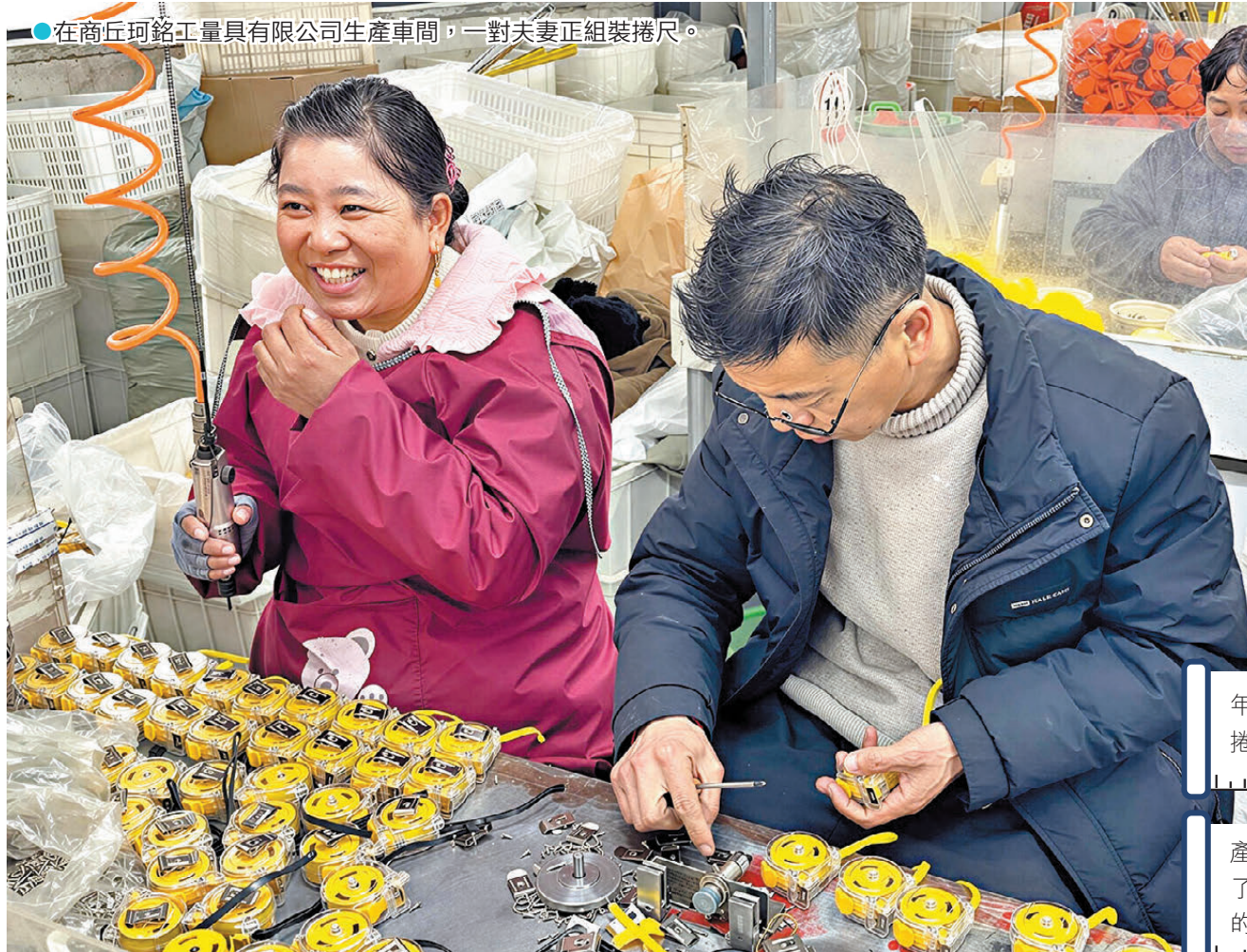
●在商丘珂銘工量具有限公司生產車間，一對夫妻正組裝捲尺。