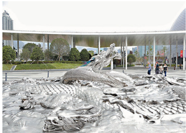
●作品取材自中國傳統文化意象「龍生九子，各有所好」。