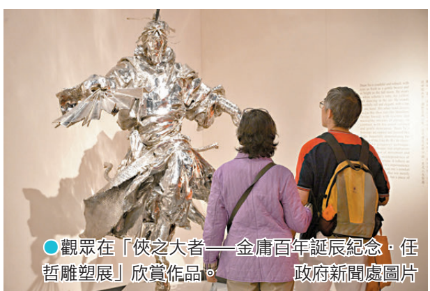
●觀眾在「俠之大者——金庸百年誕辰紀念」任哲雕塑展欣賞作品。

2023年，特區政府通過了任哲「高端人才通行證計劃」的申請。任哲表示，香港是一個非常國際化的平台，在文化交流及國際交往方面起到了極大作用。在此環境中，作品也有機會與更多海內外觀眾見面，同時獲得更大曝光度。未來，他期待幫香港植入更多具有深刻東方文化內涵的作品。