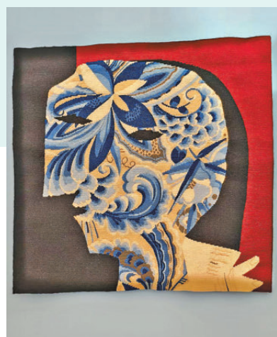
●巴布羅·畢加索的《梳妝的女人》。