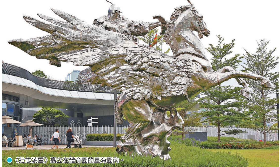
●《壯志凌雲》矗立在體育園的星海園內。