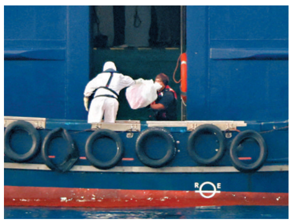
●穿防護裝備人員轉移郵輪物品。