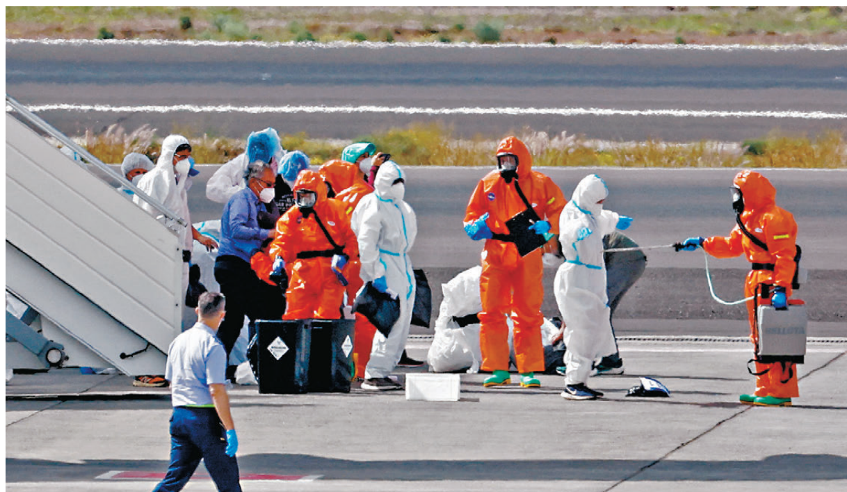
●「洪迪厄斯號」乘客在停機坪上接受消毒。