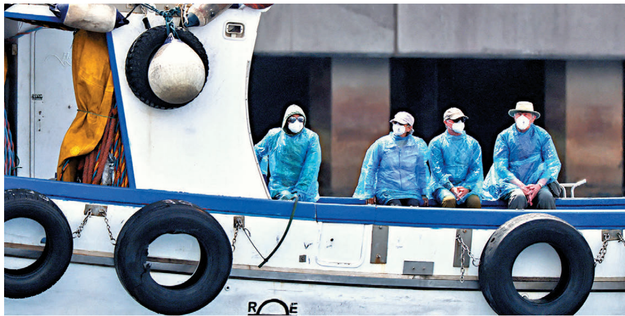
●「洪迪厄斯號」乘客離開郵輪，乘小船前往港口。

西班牙當局試圖安撫居民對病毒擴散的擔憂，當局指船上所有人目前沒有症狀，乘客在撤離航班準備就緒後才開始離船，西班牙內政大臣強調，撤離經過的所有區域及搭乘交通均已採取隔離措施，並在郵輪周圍設立海上禁區，撤離行動不會與公眾產生接觸。同時，儘管計劃是讓所有撤離人員盡快離開特內里費島，但相關部門已在一家醫院準備特殊隔離病房，以備不時之需。