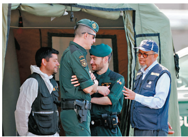
●譚德塞(右)親自到當地協調人員撤離行動。