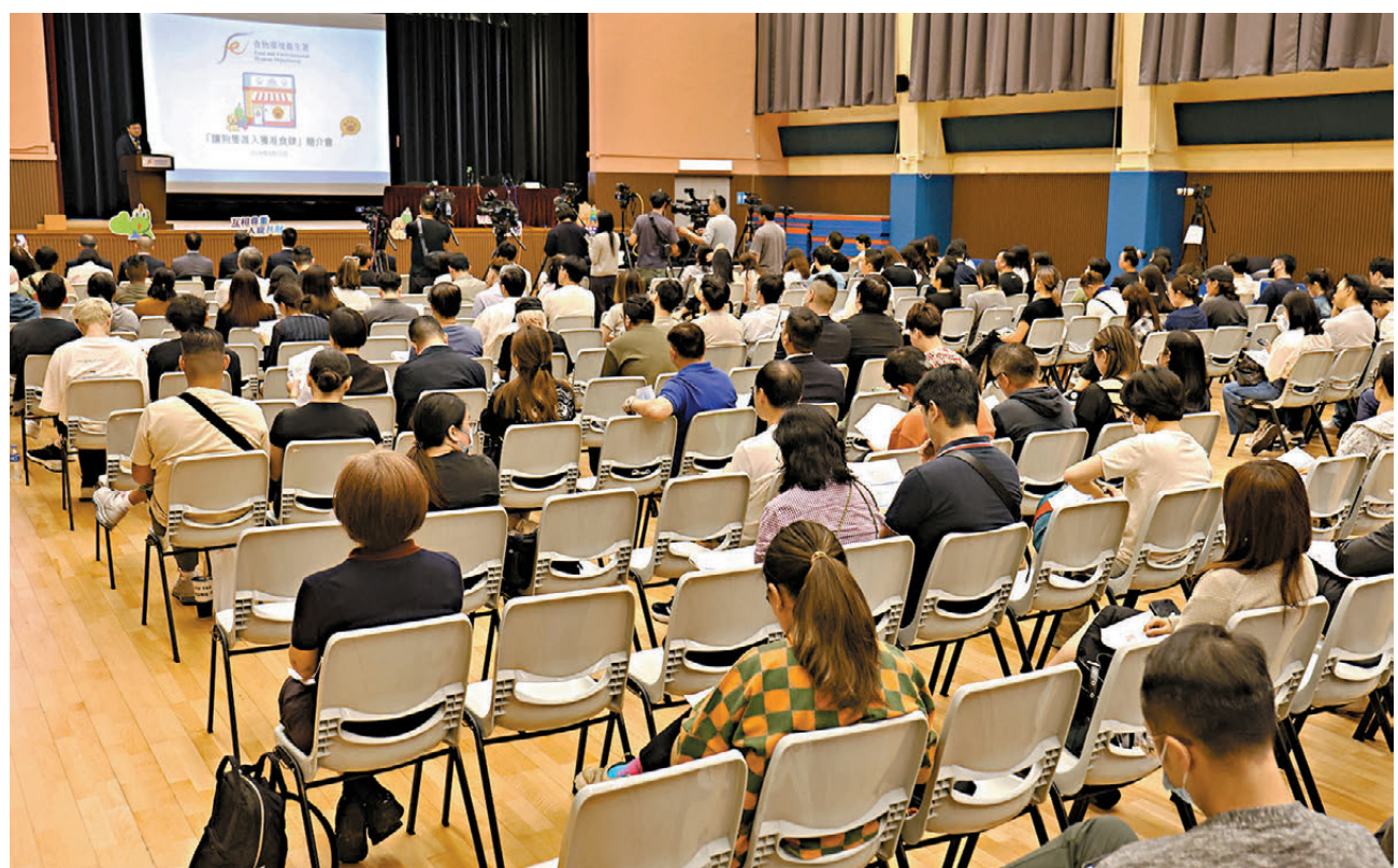
●食環署昨日舉行首場讓狗隻進入獲准食肆簡介會，有超過150名飲食界人士出席。

香港社會對人寵共融空間及寵物友善餐飲設施的訴求與日俱增，特區政府已完成相關法規修訂，將於5月18日開始接受食肆提交容許狗隻入場的首階段申請。特區政府食物環境衛生署昨日舉辦首場業界簡介會交代細節，署方表明，新安排下不會設有「分時段」的寵物友善模式，食肆一旦獲批准接待狗隻，全日所有營業時段均須嚴格遵守相關的菜式及場地規定，包括禁止在寵物友善區域進行焗面烹煮等；重申是次政策僅限於狗隻，貓隻及其他類型寵物目前仍受原有法例監管，禁止進入。食環署署長吳文傑強調，餐廳清潔的主要責任在店方，當狗隻便溺時食肆需盡快進行清潔。如果發生狗隻傷人，店方必須向警方報案，2個工作天內向食環署呈報。 ●香港文匯報記者 朱欣欣