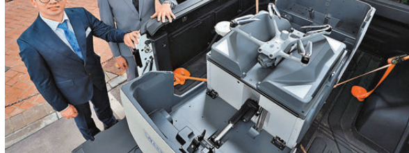
▲土木工程拓展署推出無人機聯控管理平台「智翱」，執行緊急應變和多元化資產管理任務。