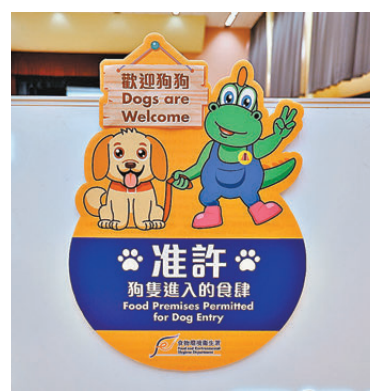
●獲批准狗隻進入的食肆，店內將貼上專有標識識別。