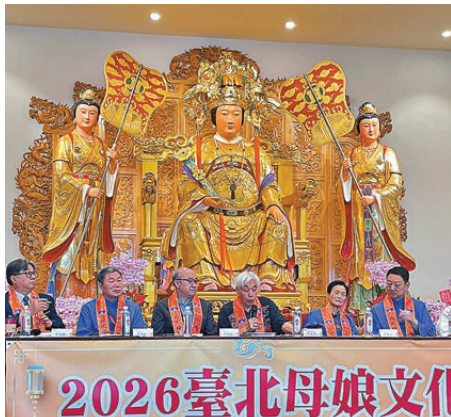
李耀輝監院在「2026台北母娘文化季國際論壇」發表演講。

在此，但願諸位同道們能夠一同懷着「普濟勸善」之心，以道教的智慧之光照射人間、滋潤人心。