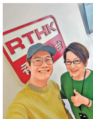
●張與辰希望另一半懂得下廚。

與辰非常感激媽媽，「我要向天下母親說媽媽辛苦晒。媽媽是一個好難做的角色，要面對很多事情，更給予子女很多啟發，正如當年我在台灣沒錢交租，銀行提款機只有數十元，要慢慢儲多數十元才可以搵出一張100元出來買飯吃，我想到媽媽一個人養4個都可以，我怎可能養自己一個也不成？所以咬實牙關又度過了。希望以後我可以令媽媽過得更快樂，活得比以前更好！媽媽辛苦晒！」