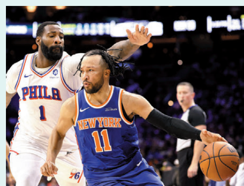
●賓遜(右)在比賽中。

同日西岸比賽，木狼在主力安東尼愛華士攻入全場最高的36分下，主場以114:109勇挫馬刺，場數追成2:2平手。