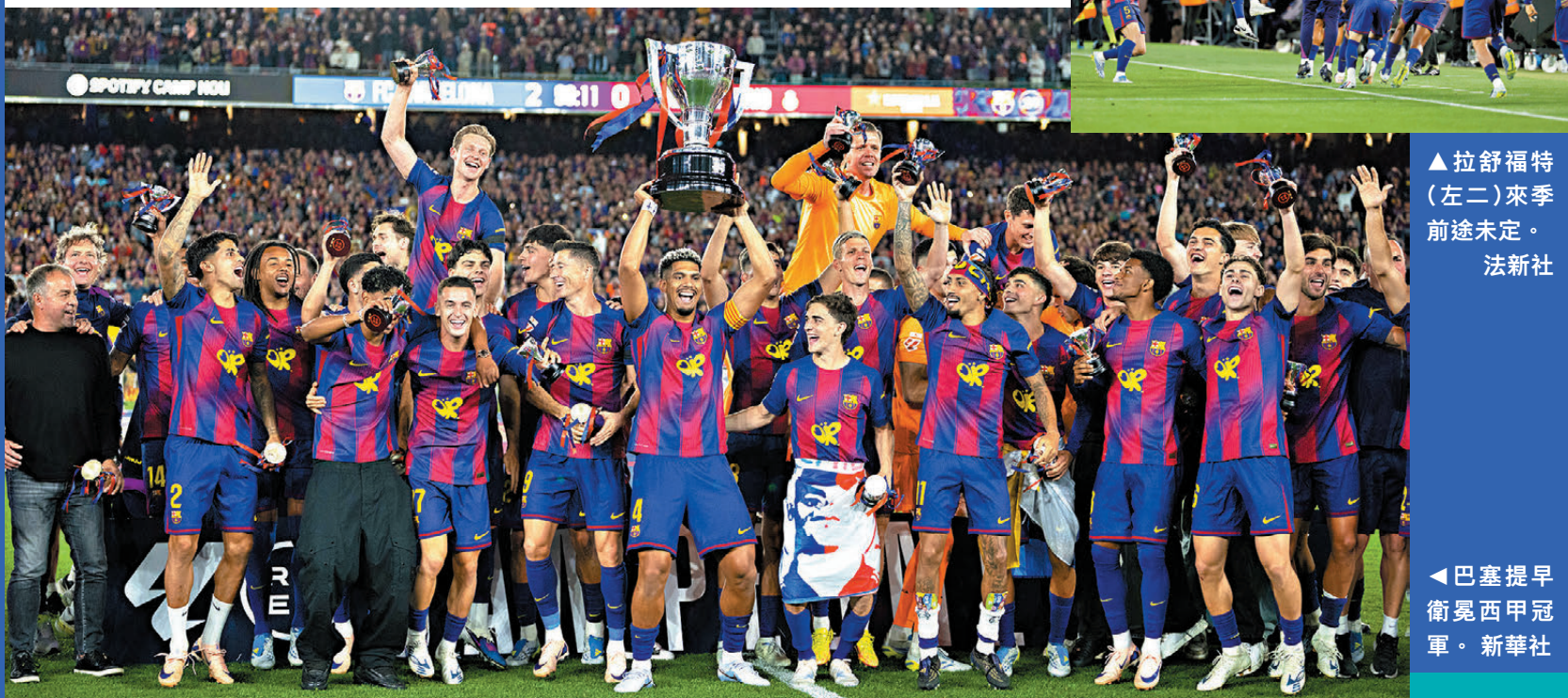
▲巴塞提早衛冕西甲冠軍。