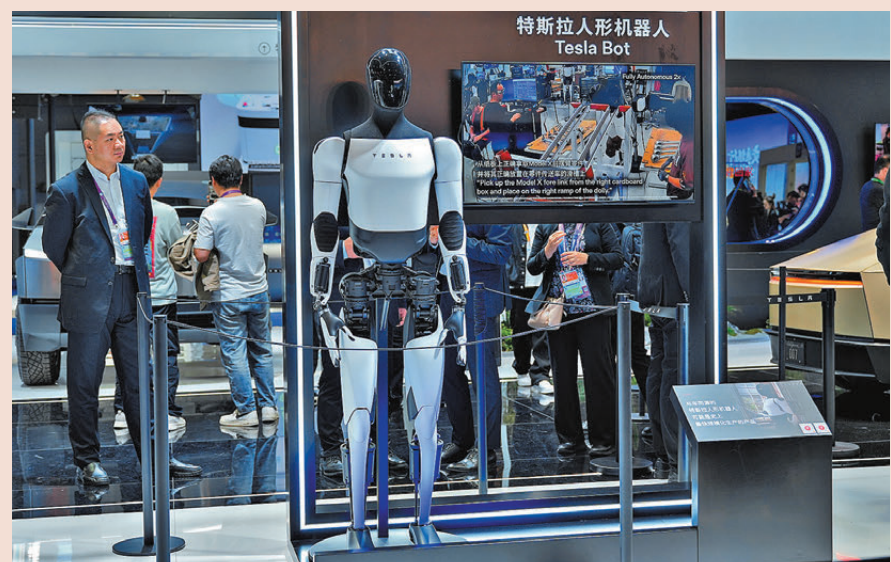
● 媒體報道，特朗普訪華團隊包括大型金融、科技、航空和農業代表。圖為在第八屆進博會汽車及智慧出行展區特斯拉展台拍攝的特斯拉人形機器人。資料圖片