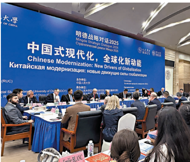
●由中國人民大學主辦，中國人民大學重陽金融研究院、全球領導力學院承辦的「明德戰略對話（2025）」為中美學者交流提供平台。

當然，對於我們這些從事中美人文交流的中國學者來說，還是要迎难而上。儘管去美國變得越來越困難，但是我們近些年通過線上交流、在京接待、第三國會議等方式，仍保持着相對較高頻率的交流，每個月都有若干批美國人士來中國人民大學重陽金融研究院交流。我們一定要為防範中美人文交流徹底脫鈎盡最大努力。