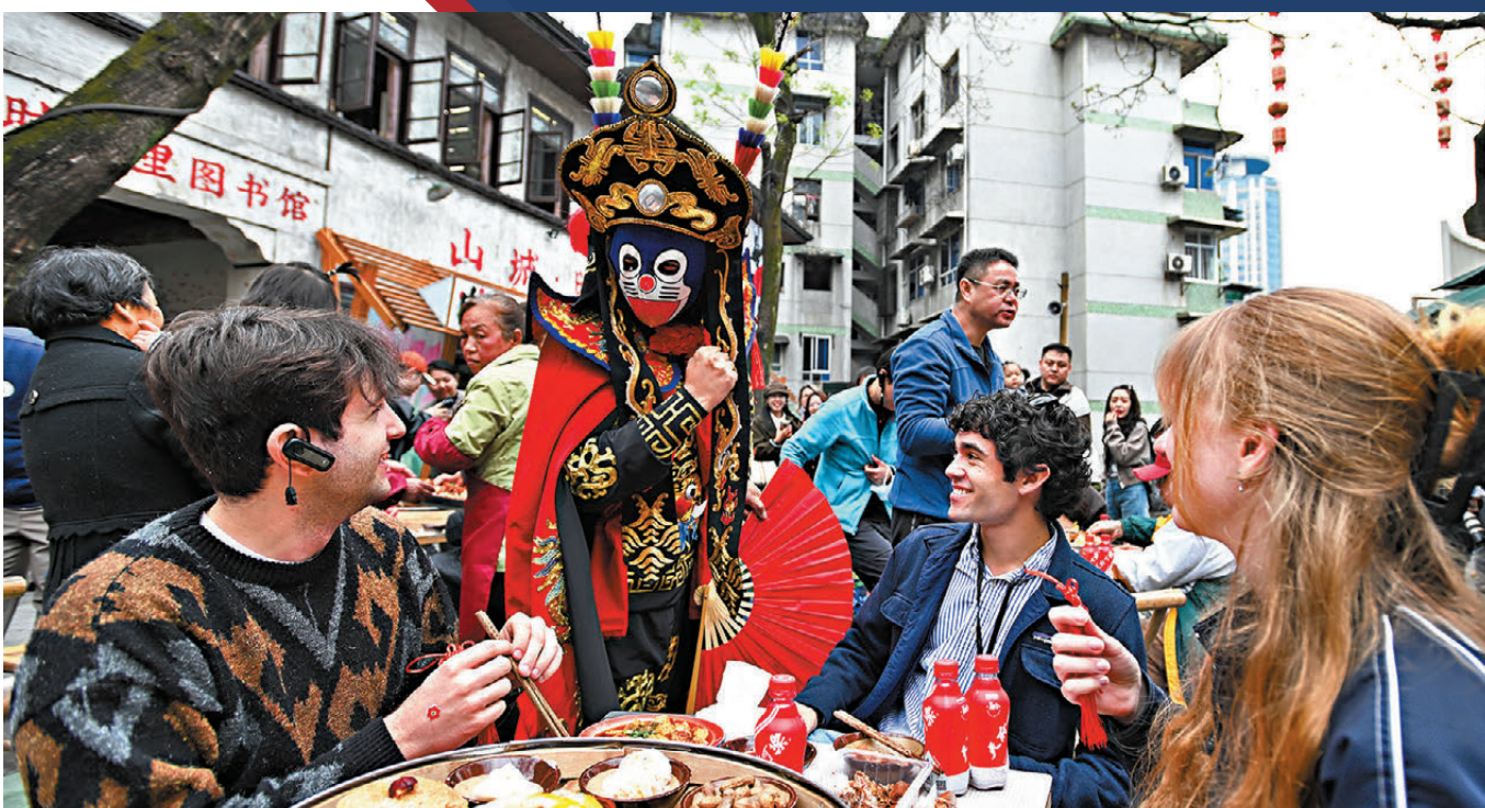
●早前，耶魯大學Whiffenpoofs合唱團成員在重慶山城觀看川劇變臉。資料圖片

嚴肅地講，中美人文交流已處在半脫鈎的狀態，甚至有全面脫鈎的危險。10年前，我和許多學者幾乎每個季度都會赴美開展人文交流或參加研討會，而現在，能夠去美國的中國學者已變成一種稀缺人員。美國來中國的學者比中國去