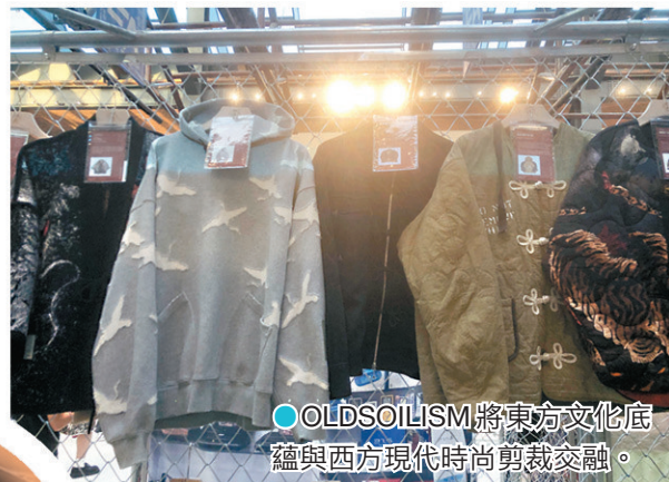
OLDSOILISM將東方文化底蘊與西方現代時尚剪裁交融。