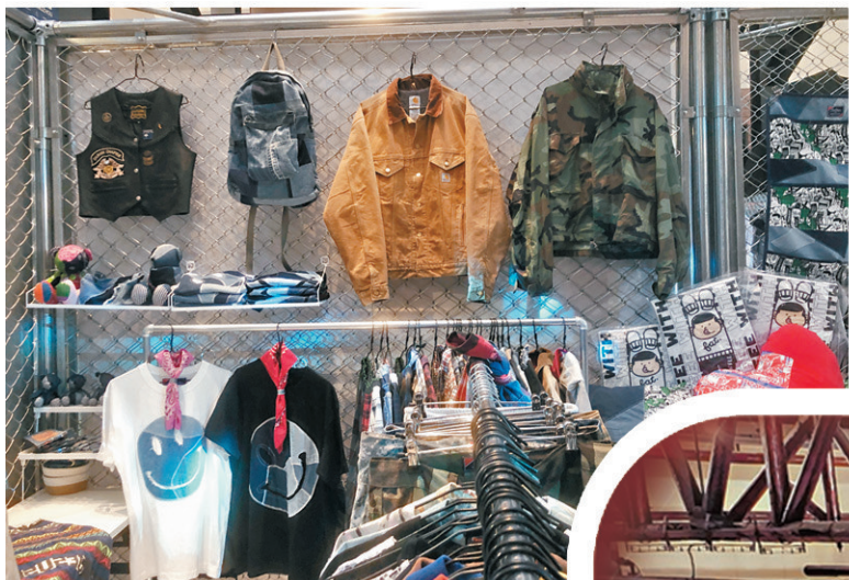
美華氏帶來更具年代感與街頭氣息風格內容。

歷來規模最大、展期最長的Hypebeast Flea與全新汽車文化單元Hypedrive，日前登陸廣州聚龍灣太古里，持續至5月下旬。現場集結了超過30個時尚、藝術與生活方式品牌，全面涵蓋服飾、鞋履、Vintage收藏、音樂藝術、潮流玩具、美食餐飲等多元類別，還展出經典名車與黑膠唱片，呈現汽車文化與黑膠音樂的交融，帶來橫跨多個周末的沉浸式體驗。這場限定盛事為華南地區的時尚人士打造了一個融合風格與文化交流的平台，引爆大灣區潮流文化能量。