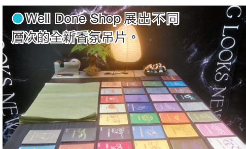
Well Done Shop展出不同層次的全新香氣吊片。

設計團隊將承載歲月痕跡的舊物進行創意解構與重新改造，將復古輪廓巧妙融入當代街頭語境之中，確保每一件誕生的服飾都具備無可取代的「孤品」屬性。這種懷舊氣息與現代潮流碰撞的重塑哲學，不僅賦予古着全新的生命力，更打造出一系列極具視覺張力與層次感的專屬單品。