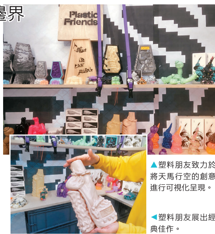
塑料朋友致力於將天馬行空的創意進行可視化呈現。

他們的作品不限於實用、陳列、收藏或互動等單一屬性，而是熱衷於在藝術、設計與製作領域展開多維度的跨界碰撞。他們享受思考與表達的樂趣，並致力於將天馬行空的創意進行可視化呈現。此次亮相Hypebeast Flea廣州站，PlasticFriends不僅帶來以往的經典佳作與部分從未曝光的珍貴Sample，更首度推出與PARKMALL合作的「招福龍」玉盤全新配色。