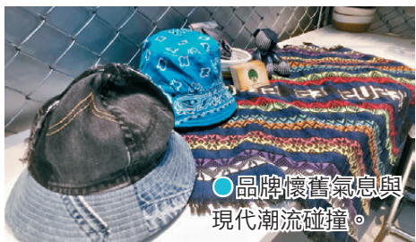
品牌懷舊氣息與現代潮流碰撞。

作為香港古着界的元祖級單位，美華氏(Midwest)自1993年創立，此次入駐Hypebeast Flea廣州站，帶來更具年代感與街頭氣息的風格內容。從舊物美學、穿搭語境到個人化收藏視角，進一步豐富了古着與生活方式層面的現場體驗。除了為玩家搜羅來自全球各地、極具歷史價值的經典古着外，美華氏攤位最大的亮點，無疑是其獨樹一幟的自家重製策劃。