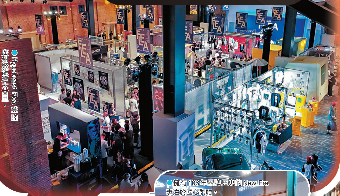
Hypebeast Flea 登陸廣州聚龍灣太古里。

隨着Hypebeast Flea廣州站圓滿收官，全新汽車文化單元Hypedrive將於5月16至17日及5月23至24日接棒登場，活動以Cars and Vinyl為主題，探索汽車文化與黑膠音樂的交融。現場不僅展出多款難得一見的經典名車，更匯聚了眾多與汽車文化緊密相連的創意單位。此外，場內亦特別規劃了專屬的黑膠轉盤區，邀請本地知名唱片行及DJ輪番上陣，與大眾無私分享他們的珍藏盤片。