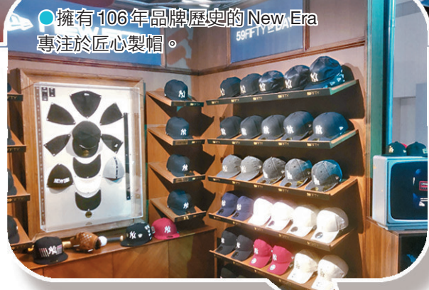
擁有106年品牌歷史的New Era專注於匠心製帽。