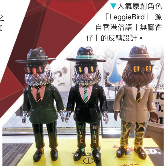
人氣原創角色「LeggieBird」源自香港俗語「無腳雀仔」的反轉設計。