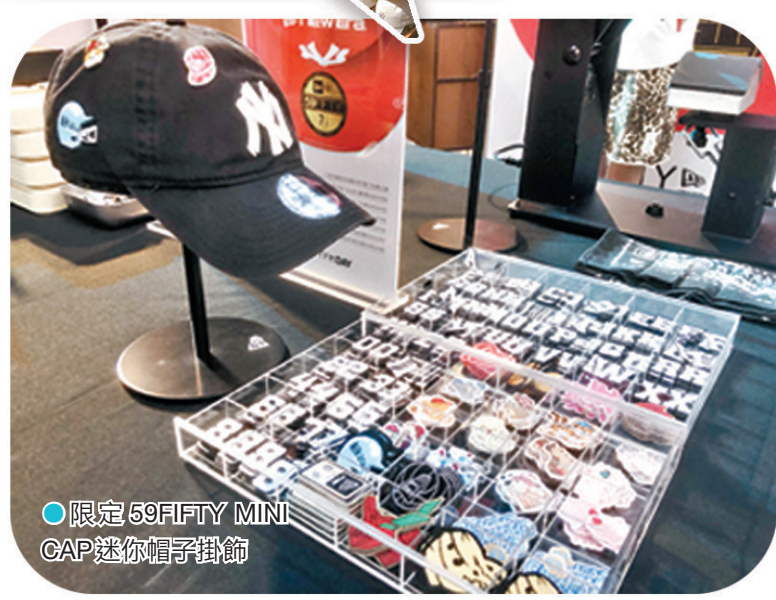
限定59FIFTY MINI CAP迷你帽子掛飾