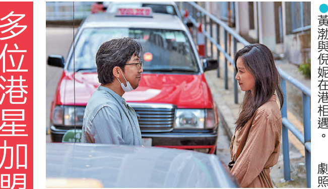
黃渤與倪妮在港相遇。劇照

香港文匯報訊（記者 阿祖）由管虎執導，黃渤與倪妮首度合作的電影《一個男人和一個女人》將於5月16日在港澳與內地同步上映。故事講述一對陌生男女因緣際會入住同一酒店，隔牆相識，在彼此陪伴中撫平生活困頓、共同成長，最終遇見更好的自己治癒故事。