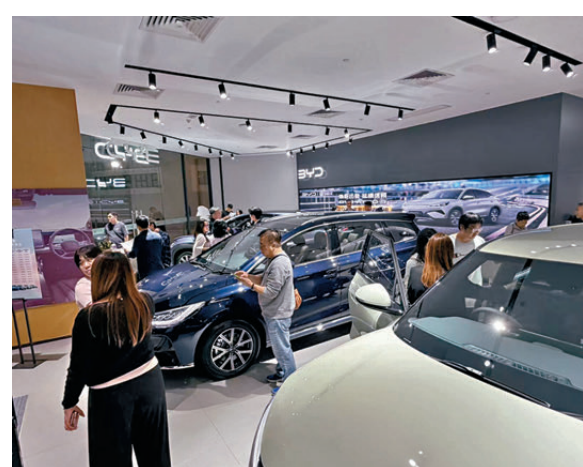
●圖為大批市民早前在「一換一」計劃期限前趕搭「尾班車」購買低稅電動車。資料圖片

香港文匯報日前翻查運輸署資料，首次登記的電動私家車數量從今年2月的3,906輛，大幅飆升至3月的9,150輛，單月升幅達134%，即使4月稍有回