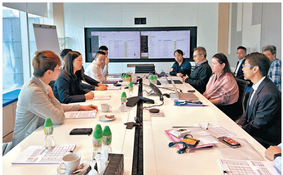
●運輸署副署長（公共運輸事務及管理）郭惠英（左二）昨日視察隧道費服務商的準備工作，了解團隊調校「易通行」系統的操作。

另一方面，運輸署副署長（公共運輸事務及管理）郭惠英昨日視察隧道費服務商的準備工作，了解團隊調校「易通行」系統的操作，以及仔細核實各隧道各車種不同收費的過程。她勉勵人員穩妥部署，做好測試，確保系統運作暢順，收費準確。