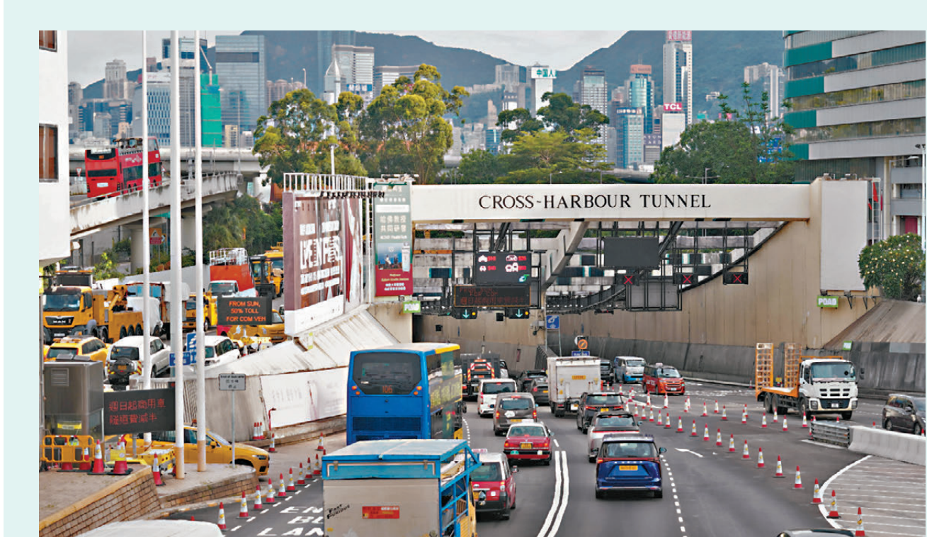
●由周日（17日）零時零分起，所有商用車輛使用所有政府收費隧道及青沙管制區的隧道費減半，為期兩個月。圖為紅磡海底隧道九龍入口。