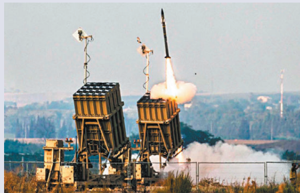
●以色列境內的「鐵穹」防空系統。

香港文匯報訊 美國駐以色列大使赫卡比12日在特拉維夫大學舉行的一場會議上說，以色列已在阿聯酋部署「鐵穹」防空系統及相關操作人員。