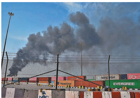
●伊朗早前襲擊沙特一間煉油廠。資料圖片

雙方最終達成諒解，同意緩和局勢。 衝突爆發後，伊朗多次襲擊中東各國境內的美軍基地，以及機場和能源基建等目標，伊朗對霍爾木茲海峽的封鎖也擾亂海灣國家石油出口。兩名西方官員透露，作為報復，沙特空軍在3月底秘密襲擊伊朗，這是沙特首次直接在伊朗領土上採取軍事行動，暫不清楚其具體攻擊目標。