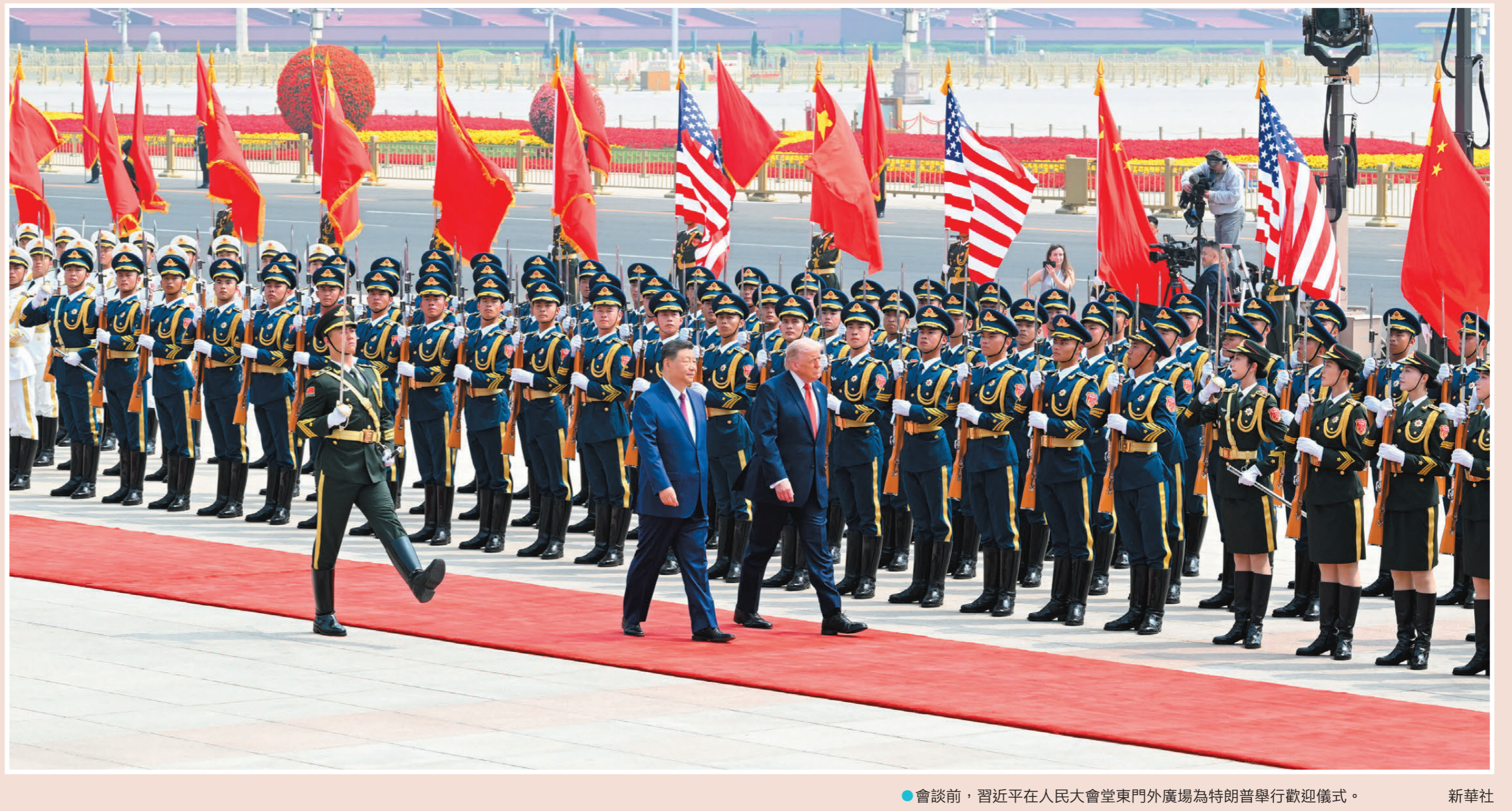
●會談前，習近平在人民大會堂東門外廣場為特朗普舉行歡迎儀式。 新華社