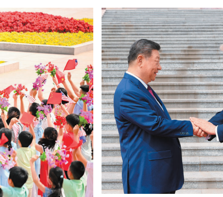
●會談前，習近平在人民大會堂東門外廣場為特朗普舉行歡迎儀式。

習近平主席在會談中提出，中美兩國能不能跨越「修昔底德陷阱」，開創大國關係新範式？能不能攜手應對全球性挑戰，為世界注入更多穩定性？能不能着眼兩國人民福祉和人類前途命運，共同開創兩國關係美好未來？這些是歷史之間、世界之間、人民之間，也是大國領導人需要共同書寫的時代答卷。回應這「時代三問」，中美元首會晤最核心的亮點就是，「中美建設性戰略穩定關係」新定位將引領兩國相向而行。 相互尊重、和平共處、合作共贏的原則，應該是雙邊關係的根本遵循，「零和博弈」「陣營對抗」是應該徹底摒棄的陳腐思維。過去十年，中美關係起起落落，從貿易戰的針鋒相對到一度瀕臨「修昔底德陷阱」的對抗邊緣。歷史反覆證明：衝突對抗只會兩敗俱傷，彼此消耗沒有贏家；唯有以誠相待、以信相交，方能行穩致遠。 中方堅定重申，中美之間共同利益遠大於分歧，中美各自成功是彼此的機遇，中美關係穩定是世界的利好，也是大國領導人需要共同書寫的時代答卷。回應這「時代三問」，中美元首會晤最核心的亮點