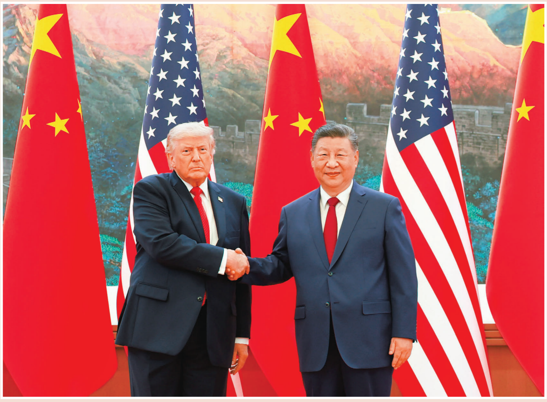
●5月14日上午，國家主席習近平在北京人民大會堂同來華華進行國事訪問的美國總統特朗普舉行會談。