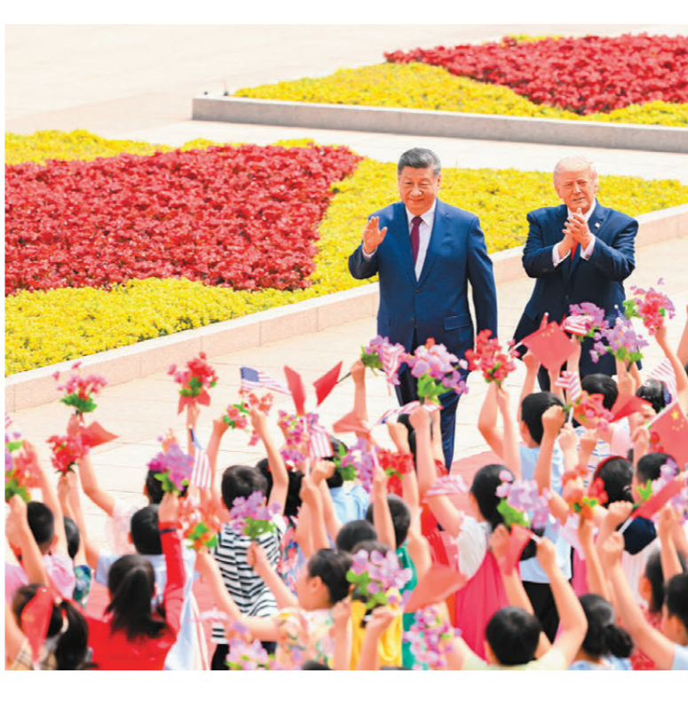
●會談前，習近平在人民大會堂東門外廣場為特朗普舉行歡迎儀式。

在世界百年變局加速演進、國際局勢紛繁複雜的當下，北京初夏的這場中美元首會晤舉世矚目。人們普遍期待，會晤為中美關係健康前行進一步校準航向、注入動力，為變亂交織的世界增添更多的穩定性與確定性，為破解全球治理困境提供大國方案，更向世界釋放出「中美穩、世界安」的強烈信號。 5月14日上午，兩個大國元首跨越太平洋的手，終於又握在了一起。人民大會堂兩個多小時的會談，讓雙方隨行人員接受記者採訪表示「極富建設性」。隨後的天壇公園，兩國元首偕行的身影，閒庭信步，談笑間，世界風雲盡在把握。 這是多麼令人感慨的時刻，對話，信步，給世界傳