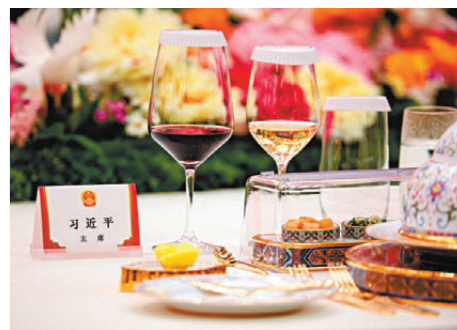
●歡迎宴會上，國家主席習近平的菜式。

特朗普表示，十分感謝習近平主席對他訪華的熱情款待。今天是美好的一天，這是一次重要訪問，雙方進行了積極和建設性的對話。美國人民和中國人民相互欣賞、相互尊重、友誼源遠流長。中美關係是世界上最重要、最複雜的雙邊關係，兩國要加強合作，為世界創造美好未來。