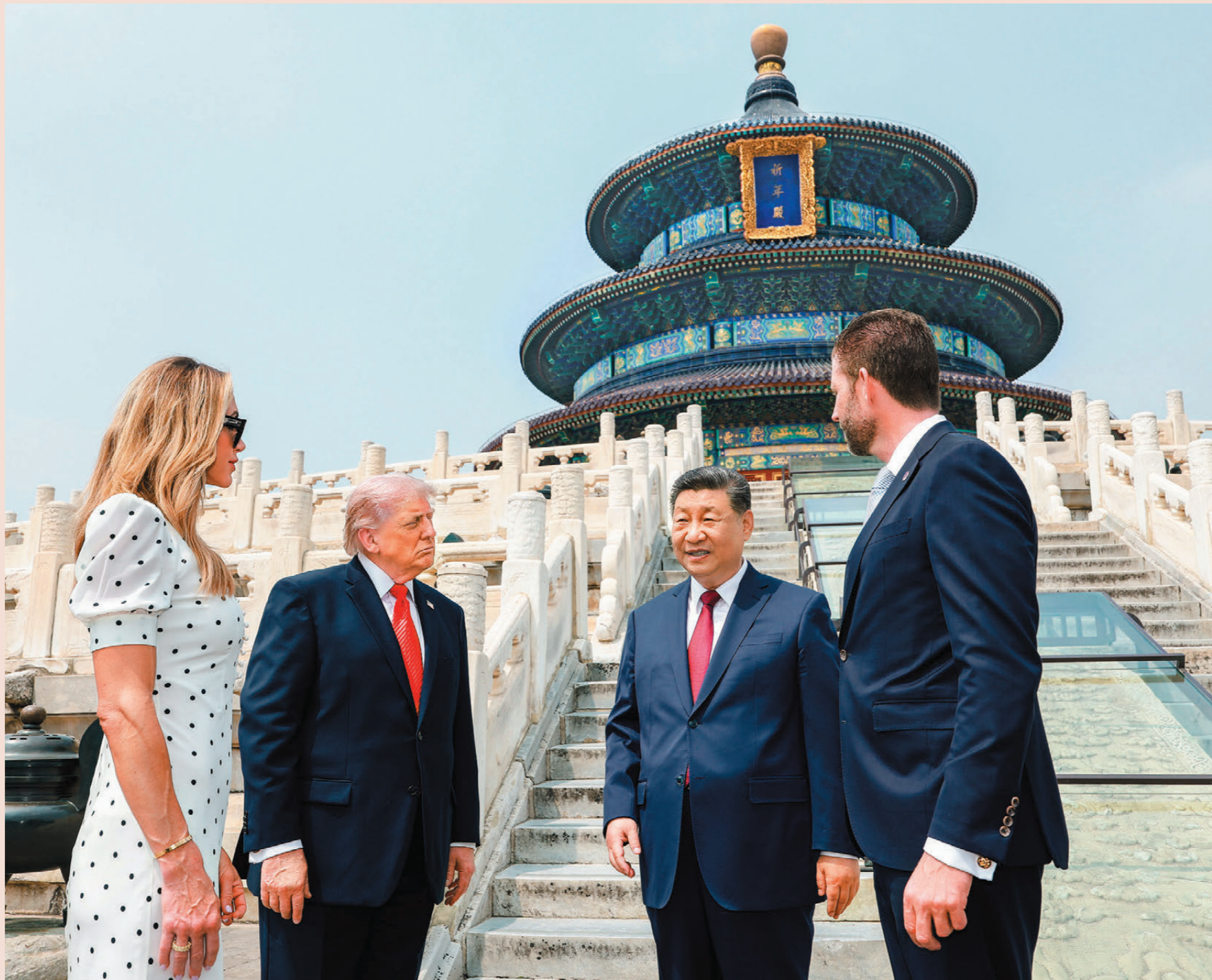
●5月14日，國家主席習近平同來華進行國事訪問的美國總統特朗普參觀天壇。