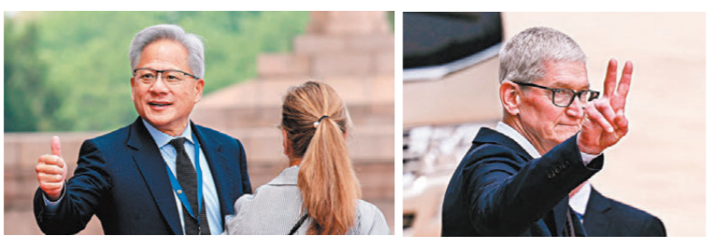
●黃仁勳點讚。 ●庫克比「耶」。