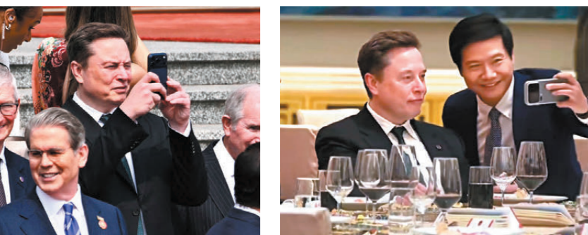
●馬斯克拍照打卡。法新社 ●雷軍與馬斯克自拍。視頻截圖