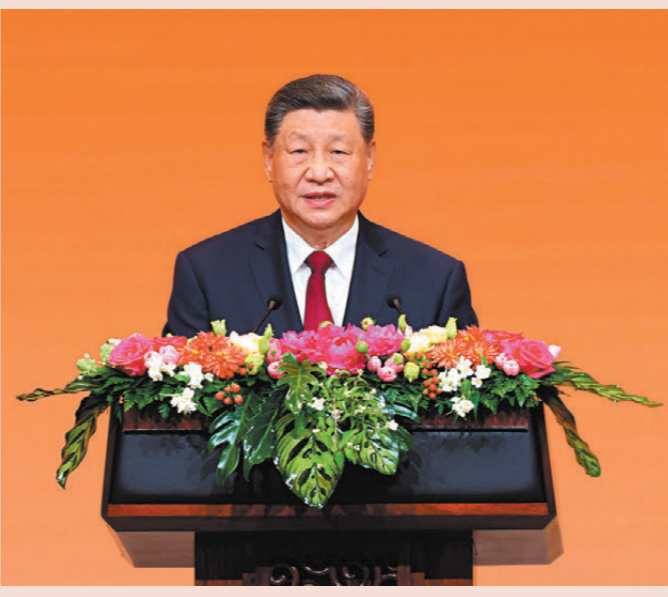
●習近平在宴會上發表致辭。