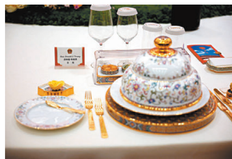
●歡迎宴會上，美國總統特朗普的菜式。