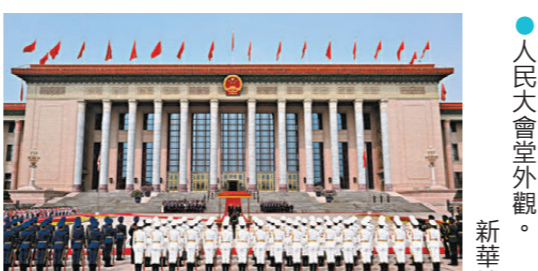
●人民大會堂外觀。