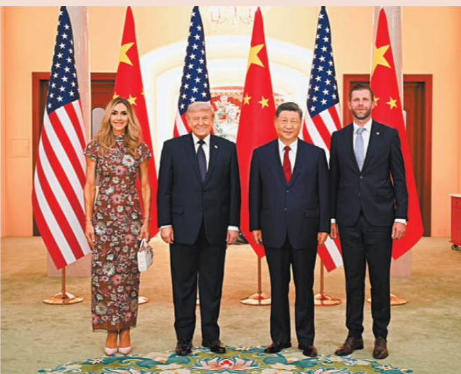
●14日晚，習近平在北京人民大會堂舉行宴會，歡迎特朗普訪華。圖為習近平和特朗普等人合照。