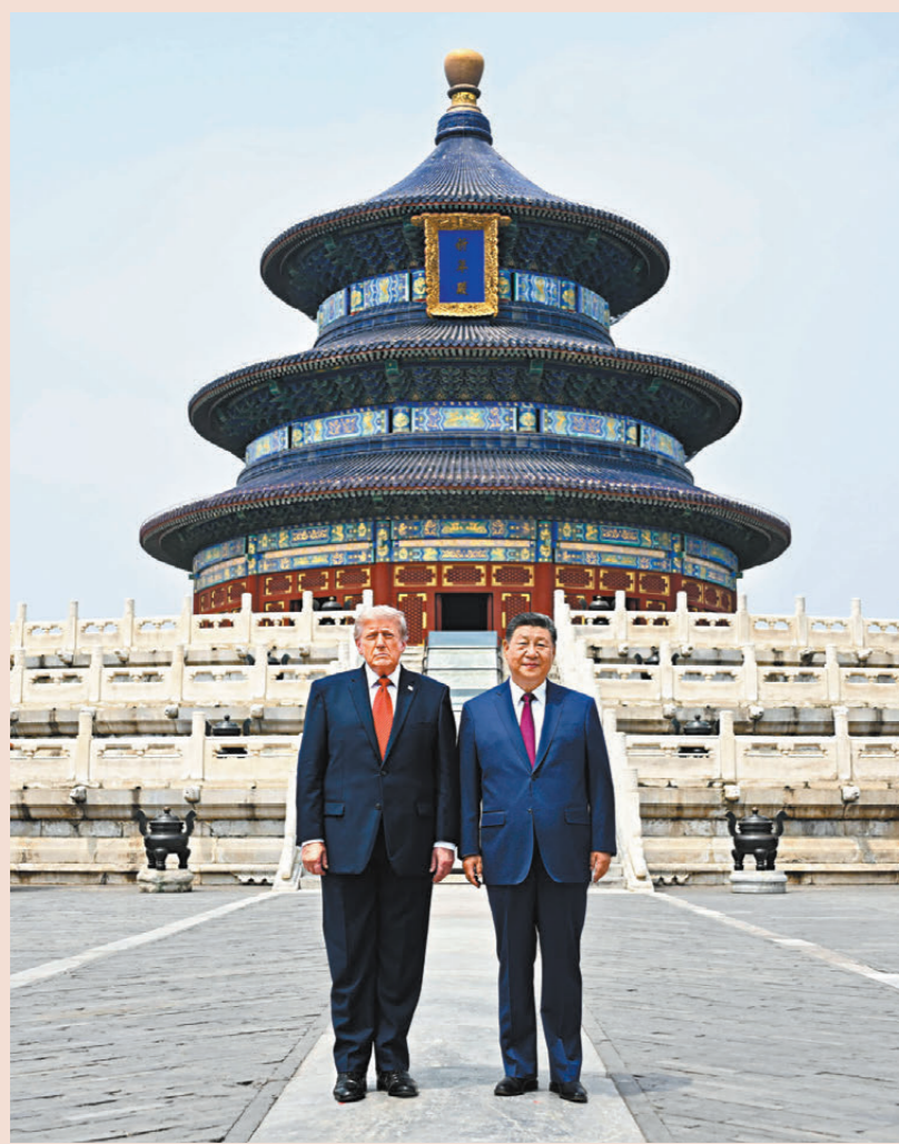
●5月14日，國家主席習近平同來華進行國事訪問的美國總統特朗普參觀天壇。兩國元首在祈年殿廣場合影。