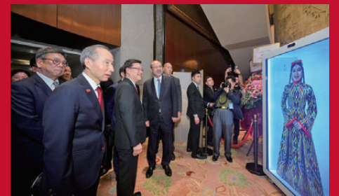
▲與會人士參觀展覽