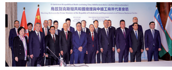
▲烏茲別克斯坦共和國總理與中國工商界代表會晤

洽談，相關項目穩步對接、加快落地，為兩地互利共贏注入強勁動力。中心將繼續堅守宗旨，全力推動合作項目落地見效，不斷拓展綠色產業、金融服務、科技創新等新領域合作，為深化香港與烏茲別克斯坦戰略合作、服務中烏全面戰略夥伴關係貢獻力量。