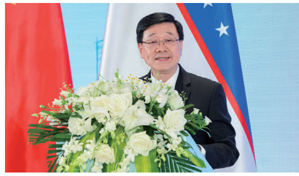
▲香港特別行政區行政長官李家超

阿里波夫： 烏茲別克斯坦與中國雙邊貿易合作前景廣闊 阿里波夫在致辭中表示，烏茲別克斯坦正大力推動經濟改革，放寬外匯及資金流動限制。過去五年，烏茲別克斯坦與中國雙邊貿易增長三倍，合作前景廣闊。他說，礦產資源對烏茲別克斯坦經濟發展具有重要貢獻，期待中國內地與香港企業在貴金屬等領域深化合作；在綠色能源方面，烏茲別克斯坦已從電力進口國轉變為電力出口國，歡迎香港企業積極參與能源領域投資項目。