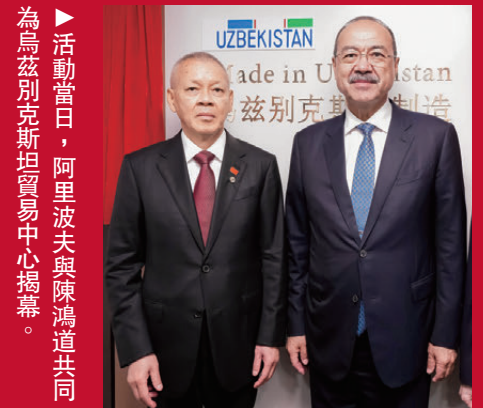
▲活動當日，阿里波夫與陳鴻道共同為烏茲別克斯坦貿易中心揭幕。

烏茲別克斯坦共和國總理阿卜杜拉·尼格馬托維奇·阿里波夫、香港特別行政區行政長官李家超出席此次商務論壇與展覽並發表致辭。中國國際文化傳播中心執行主席龍宇翔、外交部駐港特派員公署特派員崔建春、烏茲別克斯坦共和國駐港投資與綠色產業發展中心主任陳鴻道共同出席活動。