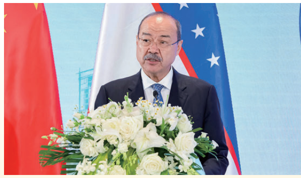
▲烏茲別克斯坦共和國總理阿里波夫

阿里波夫： 烏茲別克斯坦與中國雙邊貿易合作前景廣闊 阿里波夫在致辭中表示，烏茲別克斯坦正大力推動經濟改革，放寬外匯及資金流動限制。過去五年，烏茲別克斯坦與中國雙邊貿易增長三倍，合作前景廣闊。他說，礦產資源對烏茲別克斯坦經濟發展具有重要貢獻，期待中國內地與香港企業在貴金屬等領域深化合作；在綠色能源方面，烏茲別克斯坦已從電力進口國轉變為電力出口國，歡迎香港企業積極參與能源領域投資項目。