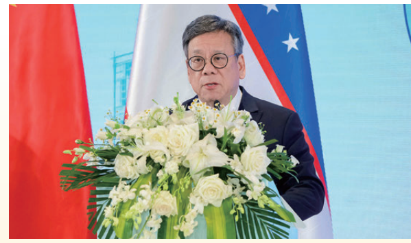
▲香港特別行政區政府商務及經濟發展局局長丘應樺

李家超： 香港是烏茲別克斯坦企業開拓中國市場的理想合作夥伴 李家超在致辭中表示，香港是烏茲別克斯坦企業開拓中國市場的理想合作夥伴。香港不僅通曉國際商業環境，更匯聚了金融、法律、會計及仲裁等領域的專業人才，能夠為國際企業提供高效、專業的服務。在全球地緣政治複雜多變、貿易投資格局加速調整的背景下，香港擁有穩定、可靠且高度國際化的營商環境，歡迎烏茲別克斯坦企業來港設立辦事處及上市。