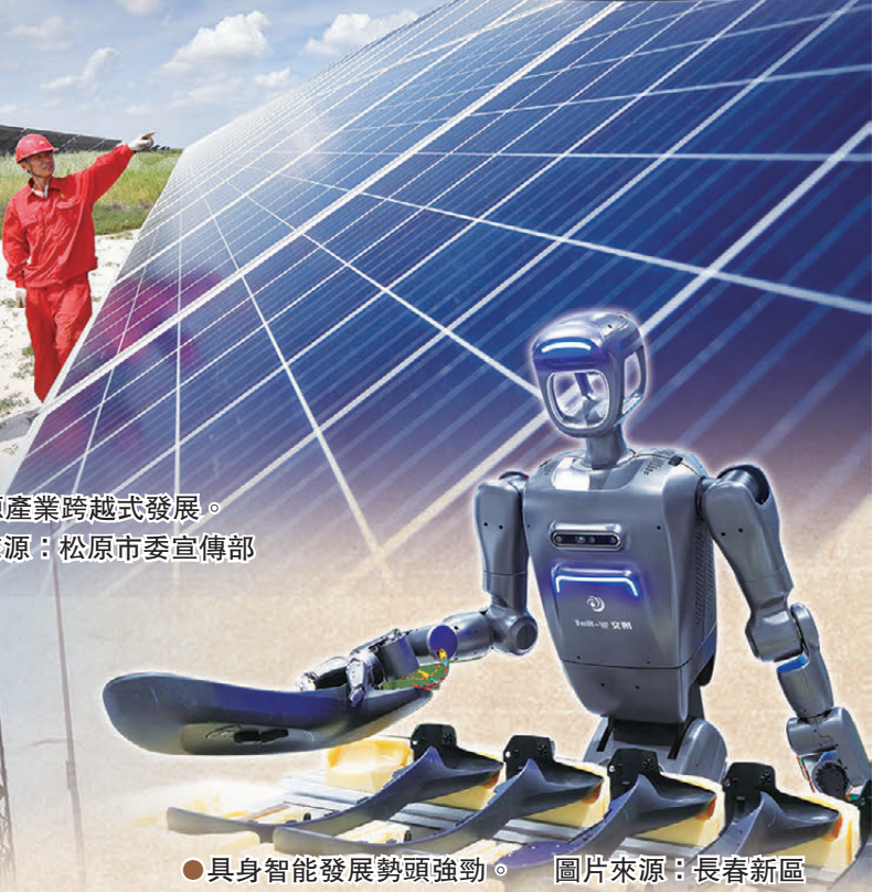
●吉林的新能源產業跨越式發展。