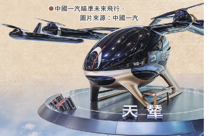
●中國一汽瞄準未來飛行。

走進位於長春新區的長光衛星指控大廳，巨大的弧形屏幕上，152顆綠色光點編織成一張密網。工作人員介紹：「這是全球最大的亞米級商業遙感星座。每顆衛星每90分鐘繞地球一圈，152顆組網運行，意味着全球任意地點平均