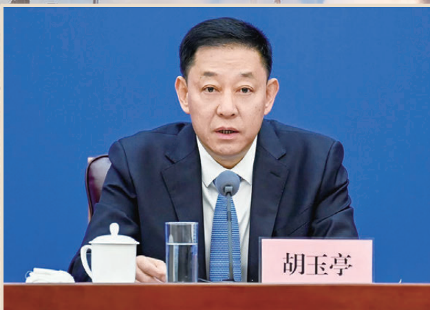
●吉林省省長胡玉亭。