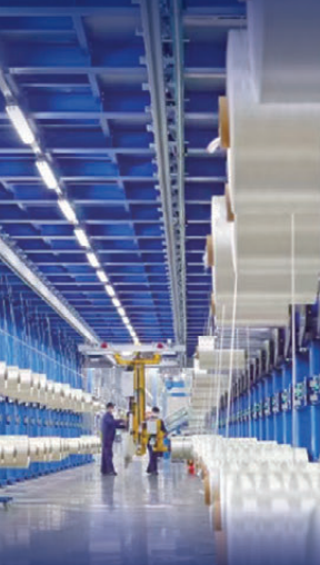
●吉林化纖碳絲製品自用率已突破40%。

企業被推上創新的主體位。「十五五」期間，吉林將實施企業研發經費投入引導計劃，支持企業牽頭「揭榜掛帥」的創新聯合體，一體化推進研發、設計、製造、應用。從「寫在紙面上」到「寫進產品裏」，這一轉變的背後，是創新鏈與產業鏈從脫節走向咬合。