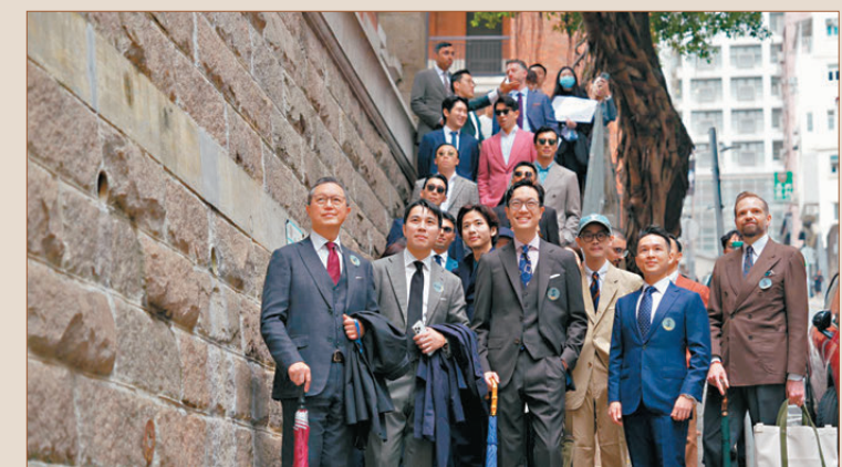
●香港首屆Suit Walk吸引眾多參與者。