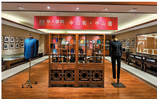
●華人禮服的定製工作坊內展出了不少新款中山裝。