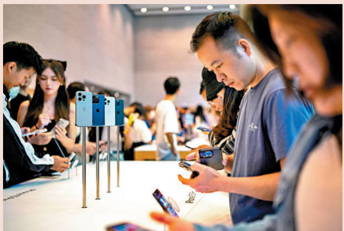
●美企高管對中國市場經濟活力充沛印象深刻。圖為上海民眾揀選蘋果手機。

香港文匯報訊 美國總統特朗普對中國進行國事訪問期間，有多名美國工商界代表隨行。他們接受新華社採訪時，一致認為美中關係至關重要，兩國元首成功會晤，能夠為中美經貿合作注入新動力，也為世界經濟提供確定性。受訪代表們稱，他們看好中國長遠發展與市場機遇，對持續拓展對華務實合作、深化經貿聯動、謀求互利共贏有強烈意願。