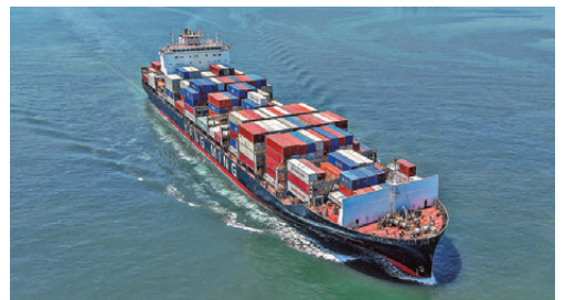
●外界關注中美能否為雙邊關係建立更多「保障機制」，不僅關係到貿易和關稅問題，也將影響未來國際秩序演變。

發言人科扎克在記者會上說，世界兩大經濟體進行最高級別的接觸十分重要，有助於緩解緊張局勢、減少不確定性。這不僅對中美兩國、對全球經濟也有好處。