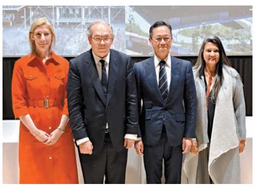
▲龐比度藝術中心及M+代表共同見證合作開始。

2027年起於M+幕牆及位於法國馬西的龐比度法蘭西島中心—藝術工廠頂層觀景台展出，進一步拓展在公共領域展示藝術作品的創新平台。同時，是次合作將支持雙方藏品互借及協同展出，促進更深入的藏品研究，提升公眾接觸兩間機構館藏的機會。 洛朗·勒邦表示，巴黎龐比度中心現正進行大規模翻新工程，預計在2030年重新迎接訪客，其間的國際合作可以幫助中心接觸新觀眾，豐富館藏並推動策展研究。