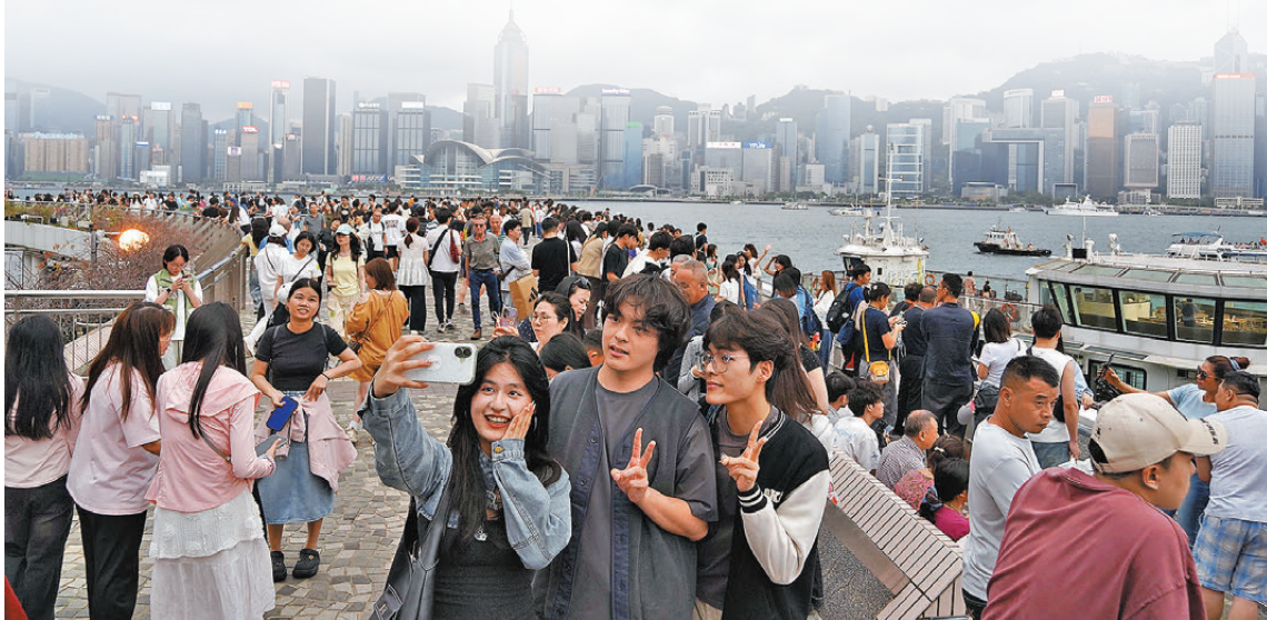
●尖沙咀近日人流暢旺。

香港旅遊發展局昨日公布數字顯示，4月內地旅客約310萬人次，非內地旅客約111萬人次，分別按年增10%及8%，而今年首4個月計，內地旅客約1,418萬人次，非內地旅客約434萬人次，分別按年多18%及8%。非內地旅客方面，當中長途旅客增幅強勁，達19%，新市場旅客亦按年上升16%（見表）。整體1,852萬人次的訪客數量已恢復至2019年首4個月水平，即黑暴及疫情前約2,381萬人次的約77%。