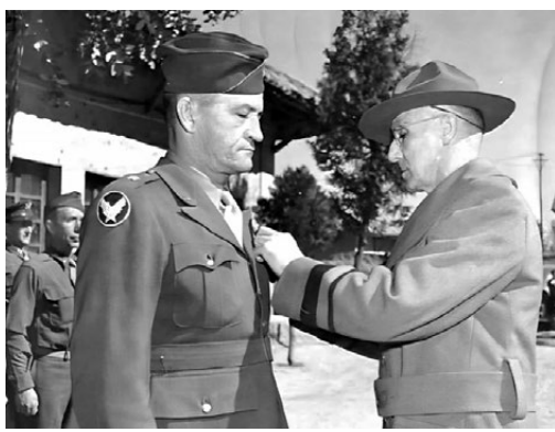
● 史迪威(右)和陳納德

而陳納德同蔣介石關係密切，他憑借與蔣介石的私交，不願接受史迪威的領導，還時常通過蔣介石向美國總統羅斯福告史迪威的狀。蔣介石因與史迪威有矛盾，尤其是對史迪威「親共」強烈不滿，就支持利用陳納德以求制衡史迪威，甚至致電要求羅斯福總統讓陳納德脫離史迪威指揮。陳納德和史迪威紛爭背後，實際上反映了當時複雜的美國對