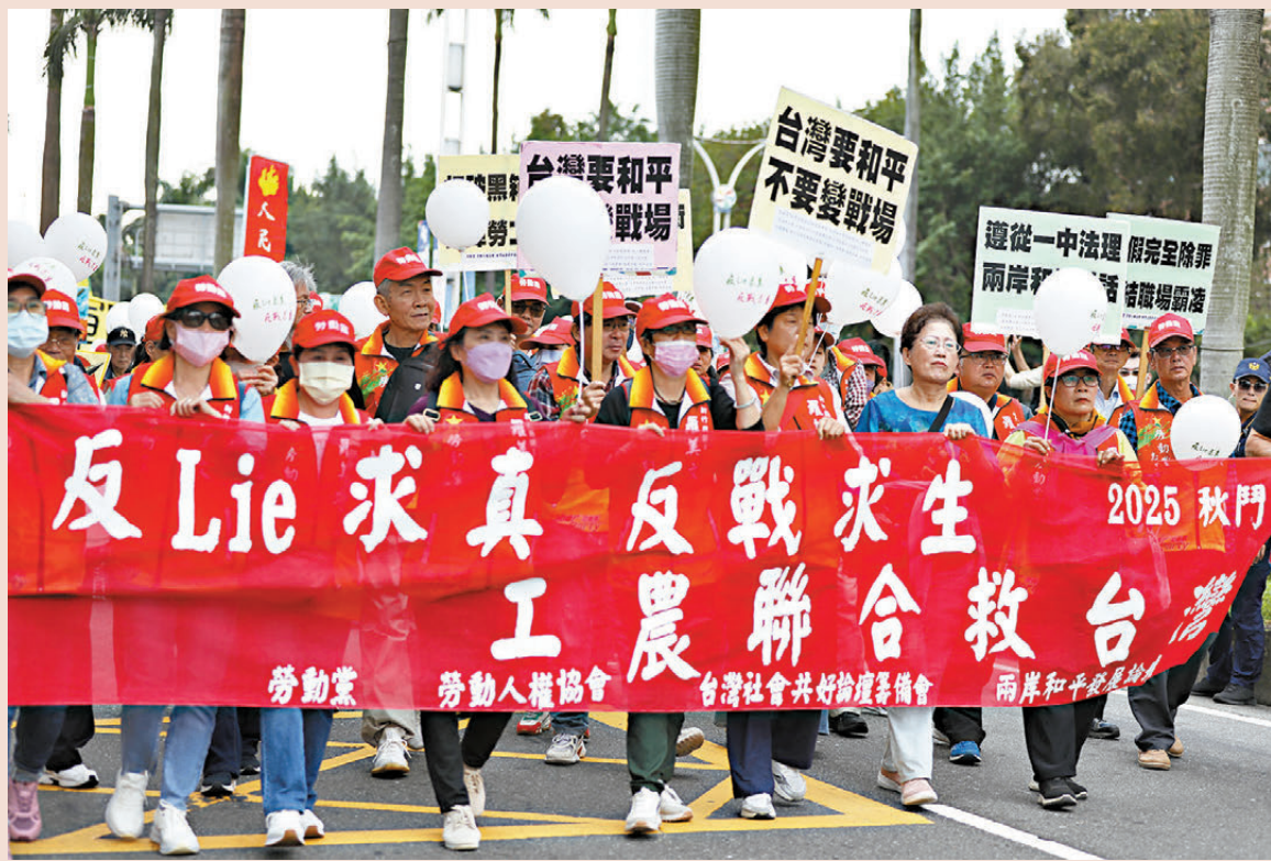
● 美方表態順應國際大勢，進一步壓縮「台獨」分裂勢力外部生存空間。圖為早前，台灣多個民間團體表達反對軍購、追求和平、改善民生的訴求。