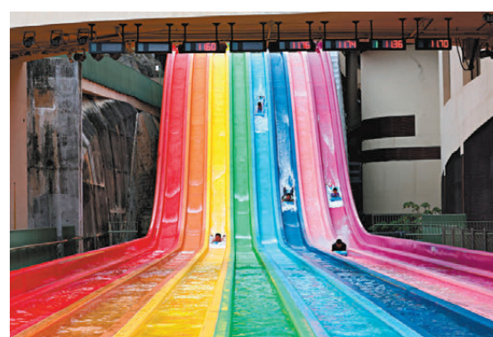
●不少人入園後直奔具代表性的設施「八彩天梯」。

開園前約1小時，水上樂園門外已出現人龍，不少家庭攜同子女到場，亦有青少年結伴前來。園方安排音樂及水槍互動炒熱氣氛，約上午10時45分起讓訪客入場，首100名入場者獲派禮品券或雪糕券。