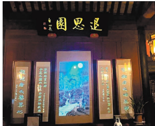
▲傳媒代表團夜遊退思園，觀賞「動起來」的古畫。