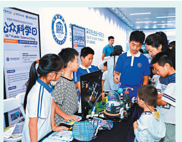
●中國科學院深圳先進院舉辦2026年度公眾科學日活動。

元，海洋公園公司董事局主席龐建貽早前指，「不敢完全否定」永久關閉水上樂園。對此，Marine表示，不少人仍未有機會好好體驗，認為園方應讓更多市民嘗試，建議加強宣傳，例如更頻密於社交媒體發放新滑水道、新餐飲及活動等資訊，以吸引更多入場。