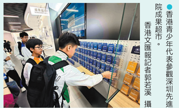
●香港青少年代表參觀深圳先進院成果超市。

香港文匯報訊（記者 郭若溪 深圳報導）在香港科技創新教育聯盟支持下，50位香港青少年代表昨日走進深圳先進院舉辦的2026年度公眾科學日現場，參觀高端科研平台，親身體驗光學成像下的海洋生物奧秘，及大腦面對壓力時如何運轉等，並與科研人員面對面交流。