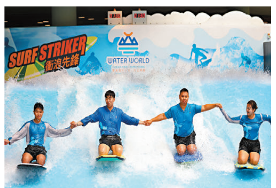
●「衝浪先鋒」教練示範。

香港文匯報訊（記者 李千尋）炎炎夏日將至，不少市民選擇玩水消暑。海洋公園水上樂園昨日相隔7個月重開，雖間中陣雨，仍無阻市民入園體驗水上樂趣。園方配合重開推出多項優惠，包括今屆文憑試（DSE）考生於重開首日以72元購票入場，60歲或以上長者及殘疾人士可享「樂悠關愛優惠」，以2元入園，優惠期至7月3日。有入場市民認為，重開配合折扣有助吸引人流，即使天氣不穩，仍願意把握機會到場消暑。