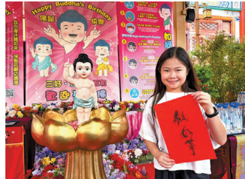
▲善信參與拓印星雲大師的「一筆字墨寶」，體驗專屬於自己的心靈文字。