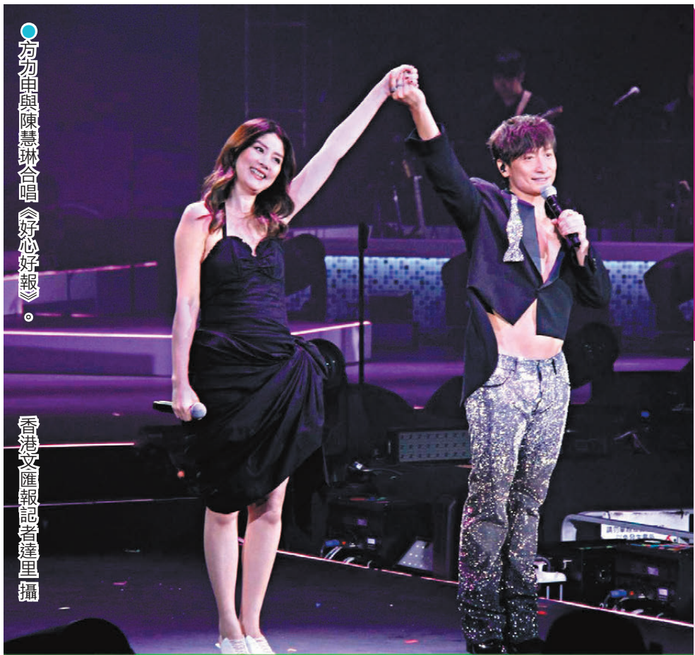
方力申與陳慧琳合唱《好心好報》。