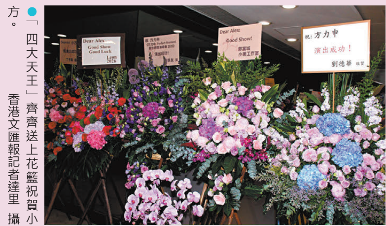
「四大天王」齊齊送上花籃祝賀小方。