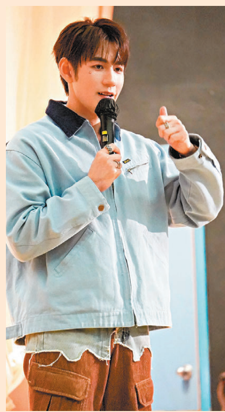
魏浚笙以自身經歷作分享。

香港文匯報訊（記者 余雁）由基督教聖約教會堅樂中學主辦的正向價值分享活動日前在校內舉行，邀請藝人魏浚笙（Jeffrey）擔任分享嘉賓，藉此鼓勵學生勇於嘗試和挑戰，以及面對困難時如何解壓。Jeffrey以自身由素人起步、逐步涉足演戲及唱歌的經歷，與全場學生分享Slasher（斜槓族）生涯所面對的壓力與解壓之道，更即場與學生大玩「猜猜畫畫」互動遊戲，場面熱鬧搞笑。