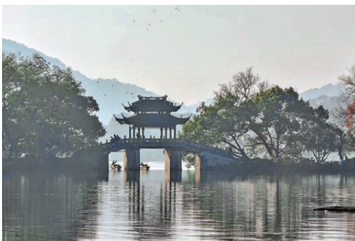
杭州曲院風荷，玉帶橋。