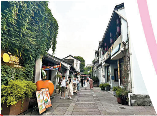
橋西歷史文化街區。

南山路（錢王祠、章太炎紀念館、蘇東坡紀念館等）→蘇堤→西泠印社→中山公園→北山街（岳王廟、蔣經國舊居等）