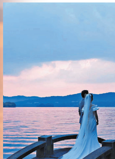
杭州長橋，新人在拍攝婚紗照。