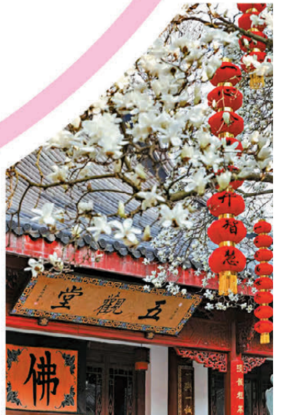
杭州法喜禪寺，玉蘭花開。