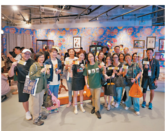
●一眾歌迷憑演唱會票尾在啟德零售館的指定食肆和商戶，會享有特定優惠。

香港文匯報訊 啟德體育園自啟用後舉行的演唱會等活動，均帶動附近一帶的生意，上周六及昨日(16日及17日)主場館一連兩天舉行林憶蓮巡迴演唱會，更全面釋放「票尾消費」潛力，啟德零售館配合演唱會舉行，推出觀眾憑當日門票可在館內指定商戶及餐飲品牌享專屬優惠，吸引歌迷提早到場消費及停留，釋放盛事活動與應援經濟的協同疊加效應，為香港盛事旅遊及高增值消費注入新動能。