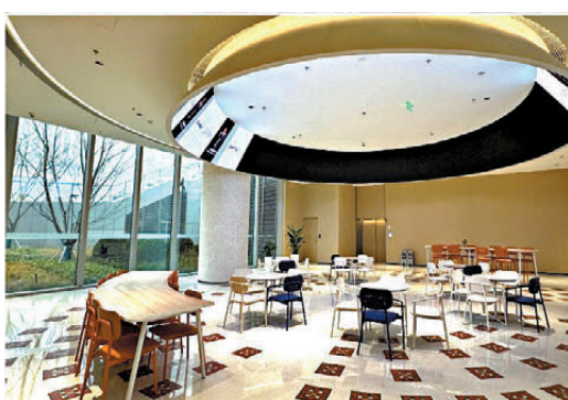
●港大計算與數據科學學院(上海)配備優質教學設施及現代化學習空間。