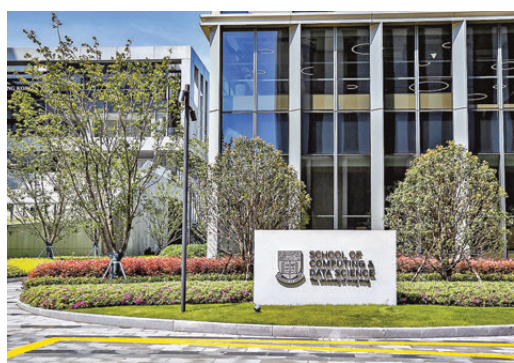
●港大計算與數據科學學院(上海)位處上海張江科學城。