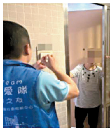
●關愛隊隊員為長者維修故障的門鈴。

與此同時，我們協助維修門鈴的服務透過鄰里推介，快速在小區內宣揚開去，我們短期內為約五十戶長者完成了門鈴維修與簡單家居整理服務，得到不少居民的好評。其中一封由受助長者親筆撰寫的感謝信令我們印象特別