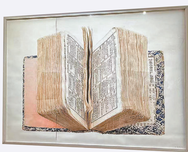
●劉丹《小辭彙》破紀錄，在富藝斯香港現當代拍賣斬獲逾8,853萬港元。

對於今年香港拍場中的亞洲買家群體，不少藏界人士都不約而同地表示，感到亞洲買家的熱情正在強勢回歸。佳士得亞太區總裁江華皓(Rahul Kadakia)則在拍後指出，「今年春拍亞洲藏家熱情參與拍賣，大中華區買家貢獻拔得頭籌。」同樣，富藝斯拍賣行在拍後表示，兩場現當代藝術拍賣中80%的買家來自亞洲，尤其是在珠寶專場，中國內地與中國香港的買家佔了總買家數的62%，貢獻整