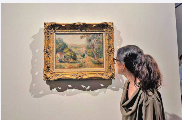
●今年多家拍賣行推出古典藝術進入拍場。