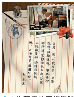
木生藉書信寄相思盼團圓。網上圖片