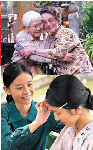
淑柔和南枝彼此守護。