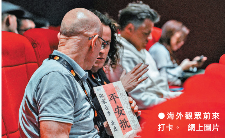
海外觀眾前來打卡。網上圖片