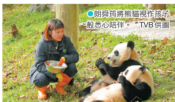
朗舜筠將熊貓視作孩子般悉心陪伴。TVB 供圖