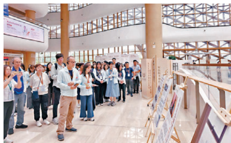
●交流團在和祐醫院參觀。

香港文匯報訊（記者 帥誠 廣州報道）香港「萬千社工看祖國『心連心』」佛山交流團昨日展開為期3天的交流考察行程，聚焦內地社福服務、醫療體系及社區治理，實地借鑒先進經驗，深化粵港澳大灣區社福界交流合作。昨日首天行程，參訪團先後走進佛山和祐醫院、桃村社區及美術館等地實地調研。