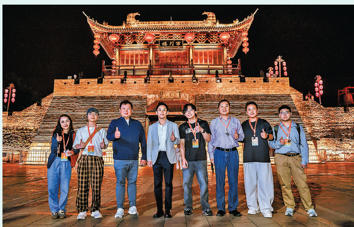
▲▼港澳青年重走長征江西行交流活動

香港青年聯會也將積極響應並參與特區政府、全國青聯及其他相關單位圍繞長征精神開展的各類主題活動，包括青年論壇、校園講座及社區推廣等，致力於青年群體中弘揚愛國主義精神，推動長征精神與當代青年發展的有機結合，為港青成長成才提供更豐富的精神滋養與實踐平台。