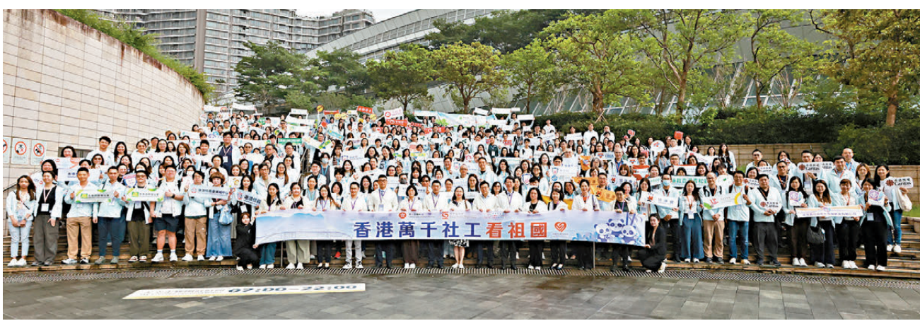
●香港萬千社工看祖國——「心連心」佛山交流團昨日上午舉行啟動禮暨出發儀式。

香港文匯報訊（記者 朱欣欣）香港萬千社工看祖國——「心連心」佛山交流團昨日上午舉行啟動禮暨出發儀式。今次交流團為期3天，吸引70間營辦津貼福利服務的非政府機構等約320名參加者。香港特區政府勞工及福利局局長孫玉菡昨日到高鐵西九龍站送行，分享團員此行將有機會參觀一間非牟利三級綜合醫院，了解「醫社結合」。他期望兩地社工藉此行輕鬆交流、互鑒互學，香港同工在分享本港社福現況之餘，亦多聆聽當地同工的工作實況，增進兩地情誼，更可拓闊專業視野、啟發服務思維。有參與者希望通過此行參考內地院舍引入人工智能系統的經驗，讓安老服務更精準、貼合長者實際需要。