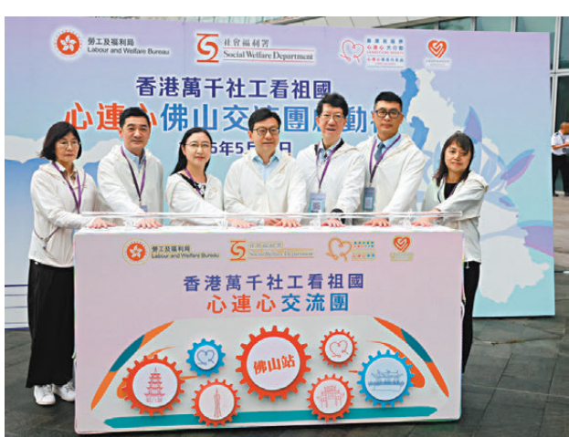
●多名嘉賓主持啟動禮暨出發儀式。

香港文匯報訊（記者 朱欣欣）香港萬千社工看祖國——「心連心」佛山交流團昨日上午舉行啟動禮暨出發儀式。今次交流團為期3天，吸引70間營辦津貼福利服務的非政府機構等約320名參加者。香港特區政府勞工及福利局局長孫玉菡昨日到高鐵西九龍站送行，分享團員此行將有機會參觀一間非牟利三級綜合醫院，了解「醫社結合」。他期望兩地社工藉此行輕鬆交流、互鑒互學，香港同工在分享本港社福現況之餘，亦多聆聽當地同工的工作實況，增進兩地情誼，更可拓闊專業視野、啟發服務思維。有參與者希望通過此行參考內地院舍引入人工智能系統的經驗，讓安老服務更精準、貼合長者實際需要。